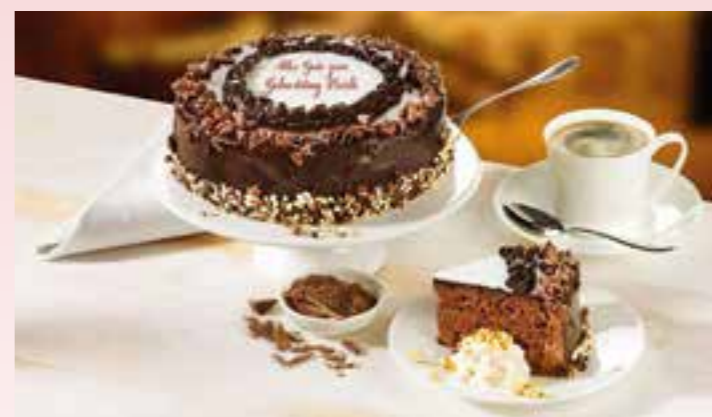
Eine süße und gleichzeitig persönliche Botschaft: Die Schokoladentorte mit individueller Beschriftung sorgt für Glücksmomente.

Ganz gleich, ob Ehrentag, Geburtstag, Hochzeit oder ein Jubiläum: