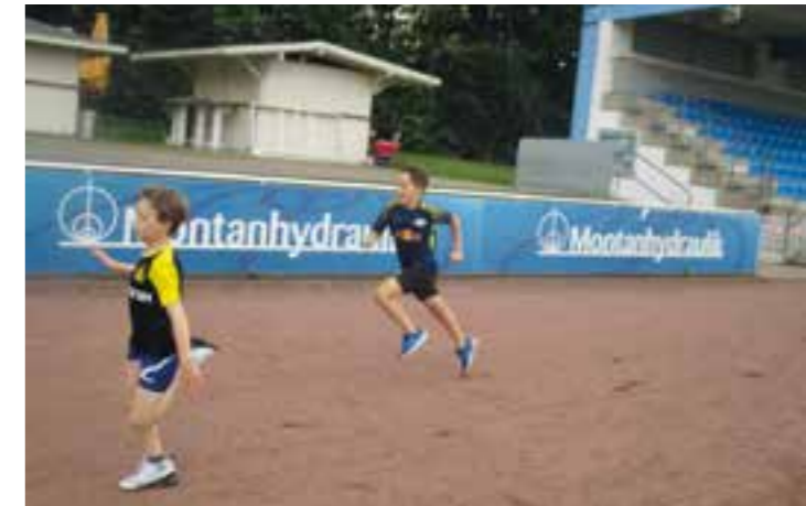
Alt und Jung absolvierten auch im Corona-Jahr 2020 die Prüfungen zum Sportabzeichen. Gerade in Pandemie-Zeiten ist es wichtig, Belastungen aller Art durch sportliche Aktivitäten weg zu trainieren oder zumindest eine Zeit hinter sich zu lassen.

In der Hoffnung, dass zu dem Zeitpunkt Veranstaltungen in diesem Rahmen wieder möglich sind, sollen dann Sportlerinnen und Sportler für die Jahre 2020 und 2021 zusammen geehrt werden. Die für den 13. Februar geplante Verleihung der Sportabzeichen