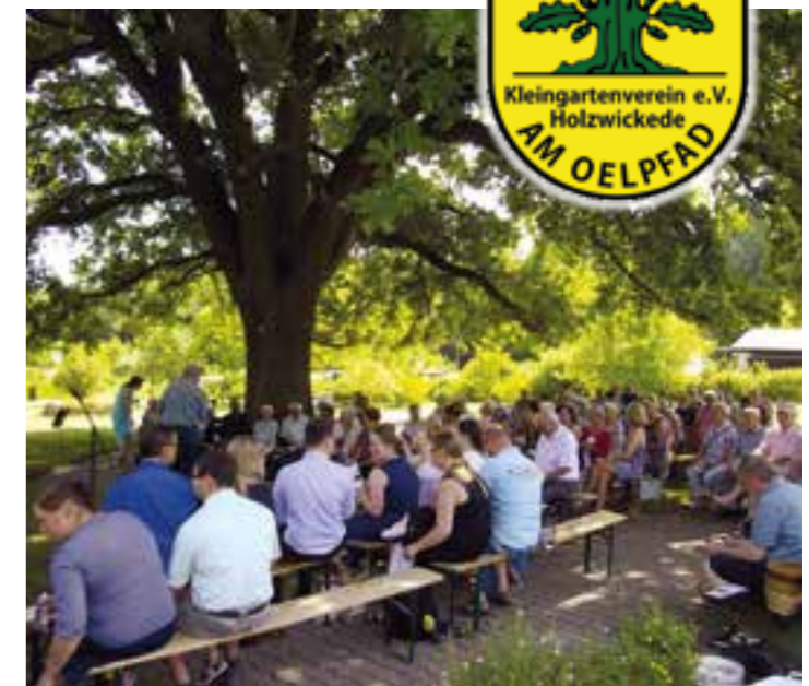
Erinnerung: 2019 Ev. Gottesdienst im Schatten der „Alten Eiche“.

Am 25. September 2020 ist die große, alte Eiche in der Kleingartenanlage „Am Oelpfad“ auseinandergebrochen.