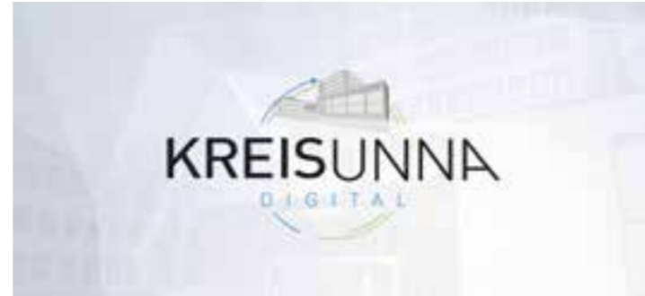
Logo Digitaler Kreis Unna. Grafik: Matthias Horstmann (Kreis Unna)

Immer mehr Dienstleistungen kann die Kreisverwaltung online anbieten: