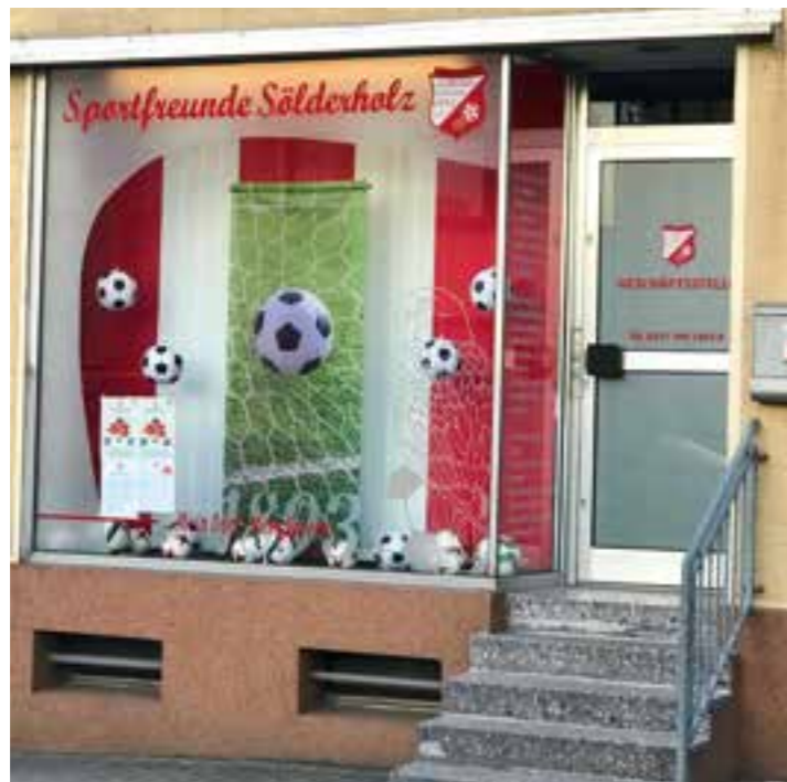
Geschäftsstelle der Sportfreunde Söldeholz, an der die QR-Code-Rallye startet und endet.

Corona lässt dies einfach nicht zu. Die Sportfreunde Söldeholz wollen dies ändern und hatten die pfiffige Idee eine QR-Code-Rallye umzusetzen. Ein Outdoor Bewegungsangebot für fußballbegeisterte Kinder mit ihren Eltern. Diese Rallye beinhaltet verschiedene Bewegungsstationen für Familien mit Kindern im Alter von 6 bis 10 Jahren und wurde in Dortmund-Söldeholz installiert. Verbunden sind die Stationen mit ihren Aufgaben per QR-Code. Mitmachen können alle Mitgliedsfamilien noch bis zum 2. Juli 2021, auch Familien, deren Kinder keine