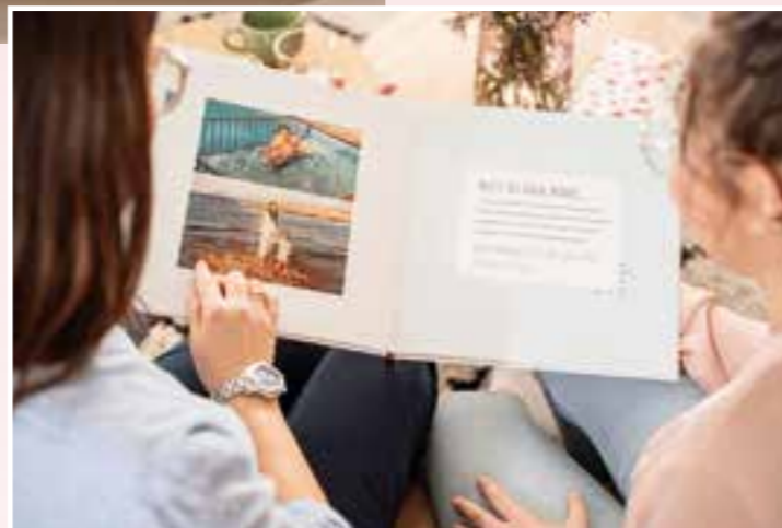
Fotobücher halten Erinnerungen an schöne, gemeinsam erlebte Geschichten auf Dauer wach.

Terminplanerin, Nachhilfelehrerin und Liebeskummertherapeutin: Mamas managen das gesamte Familienleben. Außerdem sollen auch noch die Arbeit, Freunde und Hobbys unter einen Hut gebracht werden – ohne Smartphone heutzutage unvorstellbar. Mit einer individuell gestalteten Handyhülle ist der tägliche Begleiter sicher vor Stürzen und Kratzern geschützt