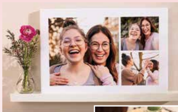
Eine individuelle Collage sorgt für Glücksgefühle – auch weit über den Muttertag hinaus.

Die Einschulung des Kindes, Bilder des Enkelkindes oder Höhepunkte einer gemeinsamen Reise: Fotocollagen beispielsweise auf einer klassischen Fotoleinwand erzählen ganz persönliche Familiengeschichten und verleihen dem Wohnzimmer eine individuelle Note. Noch mehr Platz für Erinnerungen bietet ein Fotobuch. Ergänzt mit kleinen Texten oder Zitaten lassen sich Anekdoten auf diese Weise für immer festhalten. Um die Gestaltung zu erleichtern, steht beispielsweise unter www.cewe.de in der Bestellsoftware eine große Auswahl an Vorlagen, Stilen und Cliparts zur Verfügung. Tipp: Mit einer Veredelung, ob in