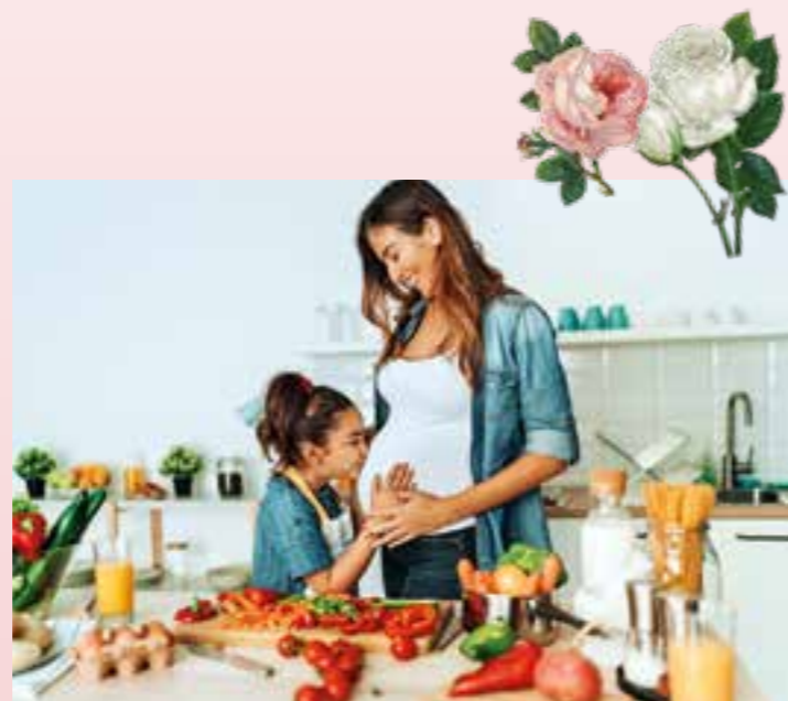
Schön schwanger: Gesunde Ernährung und natürliche Pflege sind wichtig – aber ebenso zählen Gelassenheit und Lebensfreude in dieser spannenden Zeit.