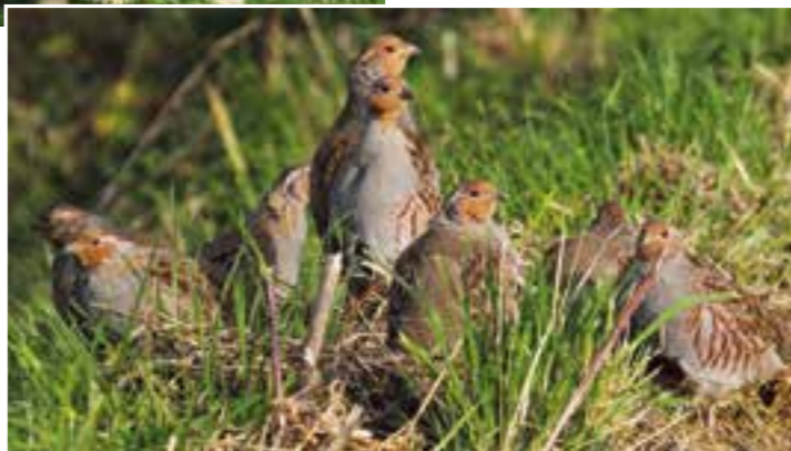
Das Rebhuhn kommt nur noch an wenigen Stellen im Kreis Unna vor.

All diese Arten benötigen Ruhezeiten für die Nahrungssuche, auch und gerade während der Zeit der Jungenaufzucht. Das gilt in gleicher Weise für das Niederwild wie Feldhasen, Kaninchen oder Fasanen. „Natürlich können Hunde weiterhin im Vogelschutzgebiet ausgeführt werden“, unterstreicht Tien. „Nur während der Brutzeit eben an der Leine. Langlaufleinen tragen dem Laufbedürfnis der Hunde im gewissen Rahmen Rechnung“, schlägt Irina Tien vor. Auf keinen Fall sollten „Stöckchen“ zum Apportieren in die Felder, Wiesen und Brachflächen geworfen und diese Flächen auch nicht betreten werden. Dies stört nicht nur die dort lebenden Tierarten, sondern auch Landwirte: Mit Hundekot versetztes Heufutter wird vom Vieh verschmäht, und nicht wiedergefundene Apportier-Gegenstände können Schäden an Erntemaschinen verursachen.