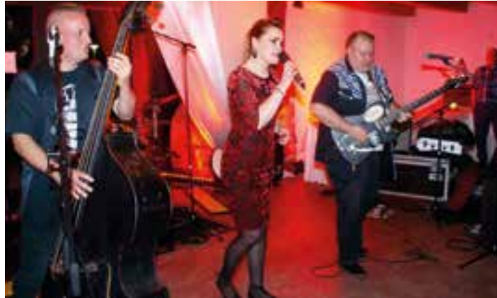
Das vorgesehene Benefizkonzert mit der Rockabilly-Band „Sandy and the wild Wombats“ am 13. November 2021 findet coronabedingt nicht statt.

Das vorgesehene Benefizkonzert zugunsten der Kinderkrebshilfe in Unna, mit der Rockabilly Band „Sandy and the wild Wombats“ am 13. November 2021 findet Corona-bedingt nicht statt.