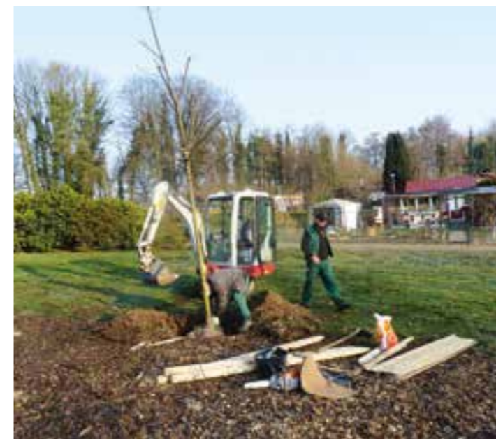
Pflanzaktion der neuen Eiche.

in der Kleingartenanlage „Am Oelpfad“ in Holzwickede