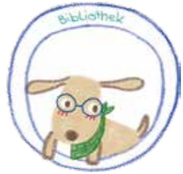
Bibliotheksmaskottchen hat nun einen Namen.