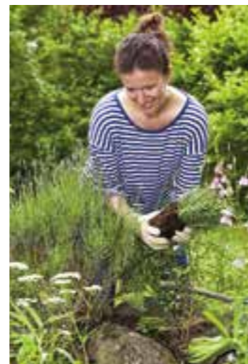
Selbst angelegte Trockenmauern sind ein bewährtes Mittel, um kleine Gärten reizvoll zu inszenieren. Zugleich entsteht so neuer Lebensraum für Bienen und andere Insektenarten.

gibt es zudem einen Ratgeberbereich mit Tipps zum Planen und Anlegen eines Gartens sowie einen Onlineshop mit den Geräten für die Gartenpflege. (djd)