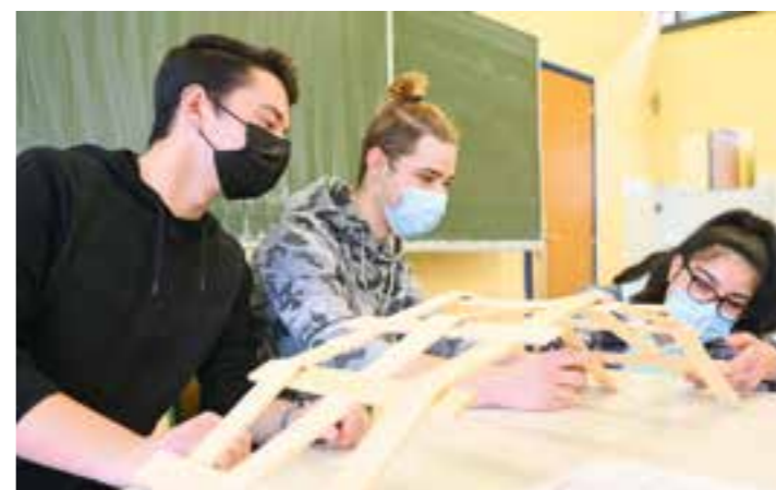
Die Schüler der neunten Jahrgangsstufe der Josef-Reding-Schule in Holzwickede waren beim Besuch des TalentParcours mit Feuereifer bei der Sache.

Mit praktischen Übungen und kniffligen Aufgaben leistete das Kooperationsprojekt der TalentMetropole Ruhr und des Technikzentrums Minden-Lübbecke e.V. auch hier einen wertvollen Beitrag zur Berufsorientierung. Denn es ermöglichte den Schülern der neunten Jahrgangsstufe, persönliche Stärken zu entdecken und individuelle Interessen kennenzulernen. Unter dem Motto „TalentTage Ruhr unterwegs“ hat der TalentParcours in den vorherigen Monaten insgesamt elf solcher Termine absolviert. Auch an der Josef-Reding-Schule probierten sich die Jugendlichen leidenschaftlich an den unter-