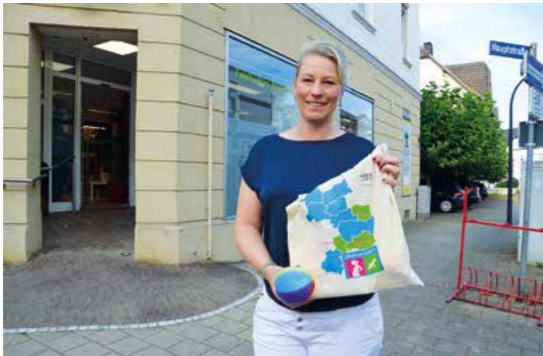
Das Familienbüro ist auch während des Lockdowns erreichbar.