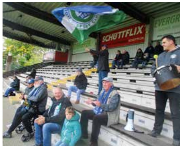
Die treuen Fans des HSC möchten ihren Verein gerne in der Regionalliga und damit in der 4. Liga anfeuern. Doch egal, ob Ober- oder Regionalliga: Die Holzwickeder Spieler können sich, wie hier bei einem Auswärtsspiel in Gütersloh, auf ihre Anhänger verlassen.

Mit dieser Entscheidung der Spieler nahm der Verein eine weitere interne Hürde bei der Entscheidung, ob man das Abenteuer Regionalliga angehen will. Aufgrund der Spielerentscheidung und nach internen Beratungen in verschiedenen Gremien prüft