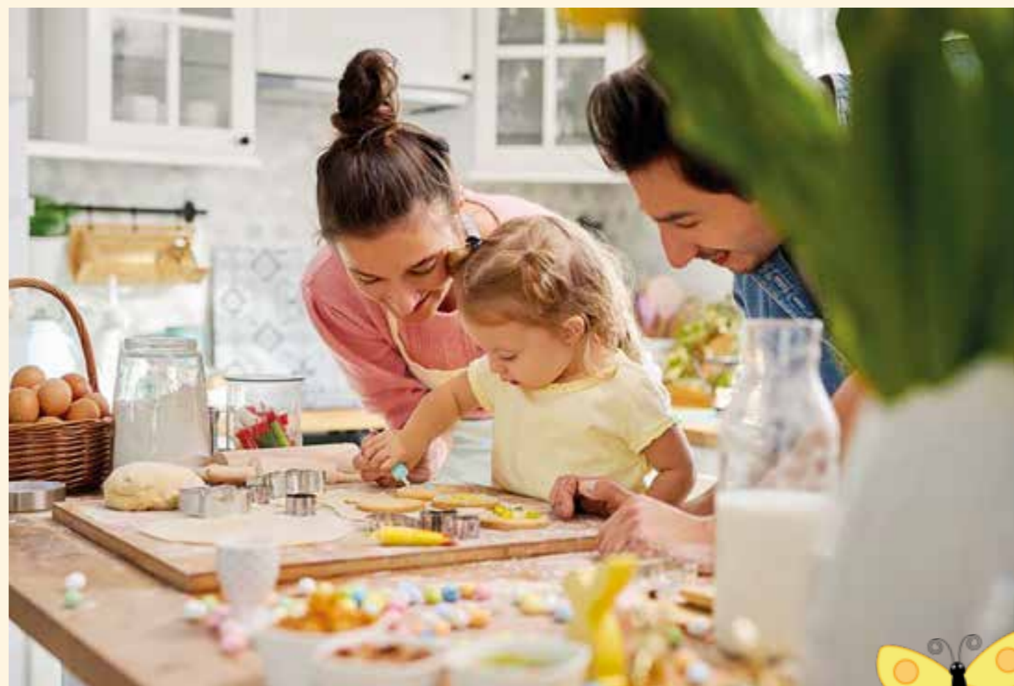
Gemeinsam mit Mama und Papa zu backen, ist eine schöne Beschäftigung an den Ostertagen.