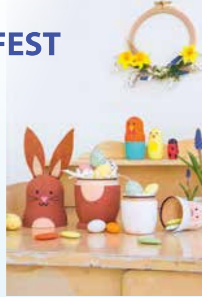
Eine selbst gebastelte, farbenfrohe Dekoration darf an Ostern nicht fehlen.

net ist. Anschließend mit einem angespitzten Bleistift Gesichter und weitere feine Details vorzeichnen. Sollte dabei ein Fehler passieren, können die Linien mit einem Radiergummi ganz einfach wieder wegradiert werden. Sobald das vorgezeichnete Motiv gefällt, kann dieses mit einem dünnen Kreativmarker (Strichstärke EF oder F) nachgemalt werden. 3. Wer einen Osterhasen in seine Matroschka-Sammlung aufnehmen möchte, kann nach dem Bemalen am Ende noch aus braunem Filz zwei Ohren ausschneiden und mit flüssigem Alleskleber am oberen Teil der Figur festkleben. Fertig ist das dekorative Oster-Gespinn. (djd)