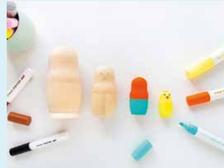
Die Tinte auf Wasserbasis zieht auf Holz schnell ein, sodass rasch weitergearbeitet werden kann.

2. Die Tinte auf Wasserbasis zieht auf Holz schnell ein, sodass direkt weitergearbeitet werden kann, sobald die Grundierung getrock-