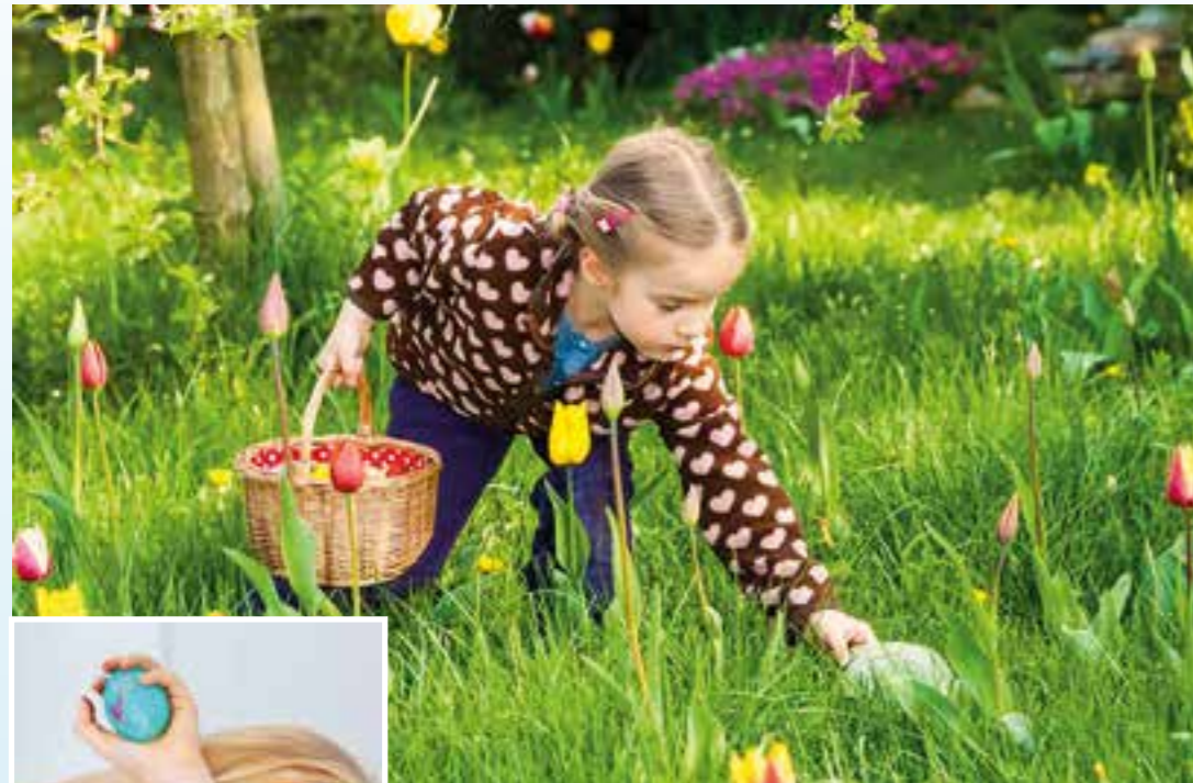
Etwas zum Naschen? Etwas zum Spielen? Kinder sind mit großem Eifer bei der Ostertüte dabei.

Kreative Ideen für passende Geschenke zum Osterfest