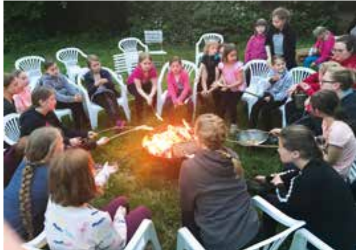
Auf der Ponyhof-Freizeit 2019 haben die Mädchen den Abend gerne am Lagerfeuer mit Stockbrot ausklingen lassen.

Anmeldezeitraum für Kinder- und Jugendfreizeiten 2021 startet