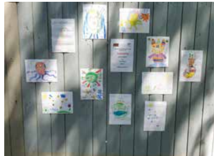
Der Bauzaun wurde um mehrere Bilder für das Kunstprojekt „Einssein“ bereichert. Kinder der 1. Klasse der OGS Nordschule haben zum Thema „Antiviren“ die Bilder gezeichnet.