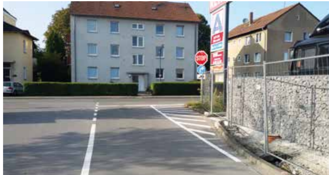
Nicht zu übersehen: Das Stopp-Schild an der Ausfahrt der Supermarktparkplätze.

Wer mit dem Auto von den Supermarktparkplätzen an der Stehfenstraße in Holzwickede fährt, muss ab sofort stoppen.