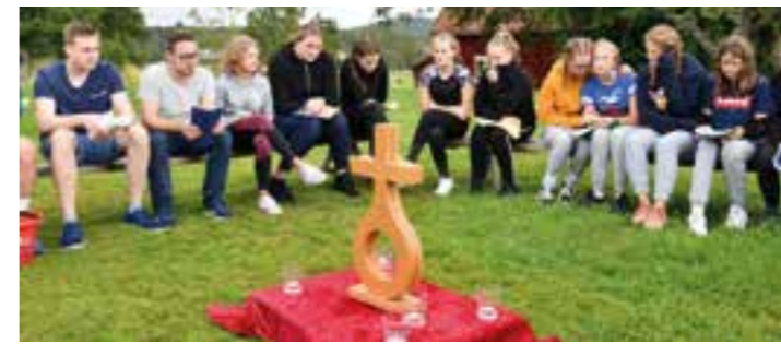
Die täglichen kurzen Andachten in Schweden geben oftmals neue Denkanstöße.

Für Jugendliche bietet die Ev. Jugend in den Sommerferien eine zweiwöchige Freizeit nach Schweden an. Für die 12- bis 15jährigen soll es in der Zeit vom 30.07. bis zum 15.08.2021 nach Hamneda Fritidsgard/Hamneda in Schweden gehen. Im südlichen Småland findet sich alles, was Schweden ausmacht: Unendliche Wälder, klare Seen, weiches Moos, rote Häuser, wilde Tiere - Davon erzählen die Geschichten. Aus diesem Gebiet kommen die Selbstbau-Möbel und Astrid Lindgrens Michel aus Lönneberga ist hier Zuhause. Die Region und die Unterkunft bieten wunderbare Möglichkeiten. Die Teilnehmer*innen dürfen sich auf eine erlebnisreiche Zeit auf einer großen Anlage mit mehreren Häusern freuen. Neben einem abwechslungsreichen Programm aus unter anderem kreativen, sportlichen, spielerischen und abenteuerreichen Einheiten liegt auch bei dieser Freizeit der Fokus auf einer starken Gemeinschaft.