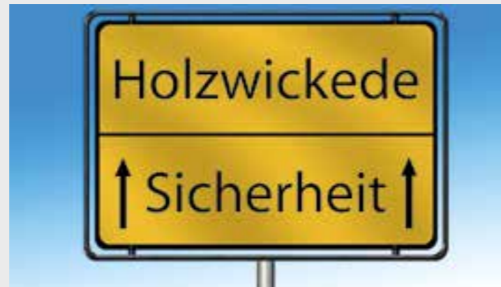
Graphik Schild: © Gerd Altmann auf Pixabay

denen es um Schutz und Überwachung im gewerblichen und privaten Bereich geht. Dabei sind kurze Wege elementar wichtig, um zuverlässig sein zu können. Deshalb begrenzt sich der Service von Sicherheit Rein in der Regel auf das Gebiet Holzwickede, Unna und Kamen. Werkschutz, Bewachung von Objekten aller Art wie Immobilien, Büros, Lagerhallen, Parkhäuser, Baustellen, Pforten- und Eingangsdienst zum Beispiel bei Kaufhäusern und Firmen, Urlaubsbewachung des Eigenheimes, Hotelsicherheit, Öffnungs- und Schließdienste, und sogar der sichere Transport von wichtigen Dokumenten gehören zu den Leistungen von Rainer Rein und sei-