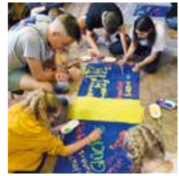
Gemeinschaft ist auch auf der Schwedenfreizeit wichtig, hier wird gerne gemeinschaftlich kreativ gearbeitet.

Der traditionelle Anmeldestart für die Freizeiten ist der Holzwickeder Weihnachtsmarkt. In diesem Jahr findet der Weihnachtsmarkt nicht statt, weshalb die Ev. Jugend Holzwickede und Opherdicke den Anmeldestart für die Freizeiten auf Sonntag, den 1. November festgelegt hat. An diesem Tag haben Interessierte die Möglichkeit, in der Zeit von 17:00 bis 19:00 Uhr im Ev. Jugendheim (Goethestr. 6a) vorbeizukommen und die Anmeldung persönlich abzugeben oder offene Fragen zu den Freizeiten zu klären. Anmeldungen können ab Montag, den 2. November auch zu den Öffnungszeiten