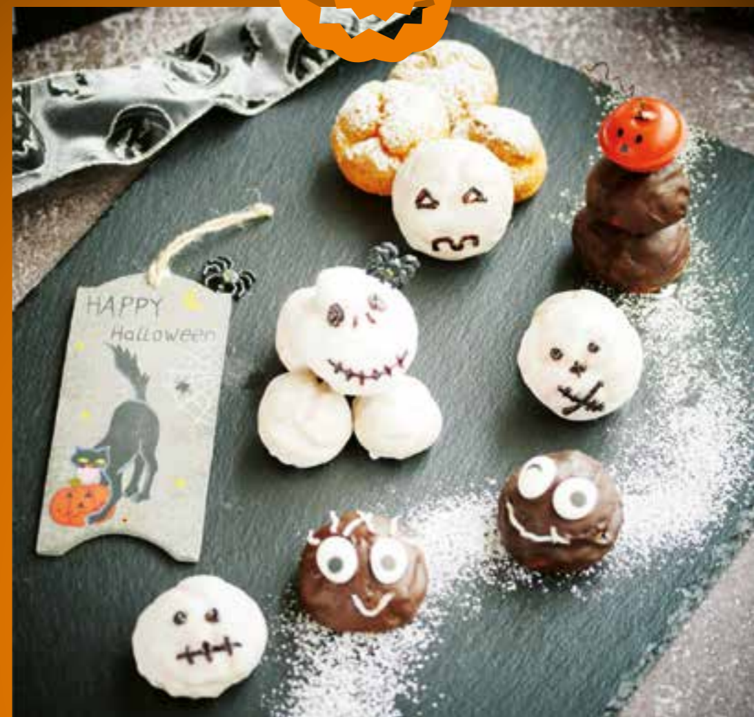
Die schaurig-süßen Geister und Monster Windbeutel sind die perfekten Halloween-Gebäcke für Klein und Groß.

Rezept für die Geister und Monster Zutaten für die Windbeutel: 120 g KOMÉKO Kuchenglück (oder handelsübliches Mehl), 1 Prise Zucker, 100 g Wasser 100 g Milch, 100 g Butter 4 Eier (Gr. M).