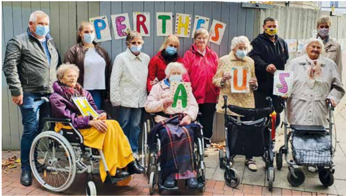
Der Bauzaun wurde am 05. Oktober 2020 um ein Kunstwerk bereichert. Bewohnerinnen des Perthes-Hauses haben aus einzelnen Bildern ein Gesamtkunstwerk geschaffen, das beim Pressetermin gemeinsam mit den Bewohnerinnen des Perthes-Hauses am Bauzaun angebracht wurde.

„In dieser außergewöhnlichen Lebensphase, die uns alle betrifft, möchten wir den Menschen den Zugang zu etwas Besonderem ermöglichen und Hoffnung und Zuversicht schenken“, so die Holzwickeder Bürgermeisterin Ulrike Drossel.