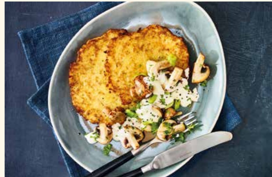
Die Reibekuchen mit Pilzschmand sind schnell zubereitet und schmecken lecker.

Küchenfertige Kartoffelprodukte sparen Zeit und bringen Abwechslung auf den Speiseplan