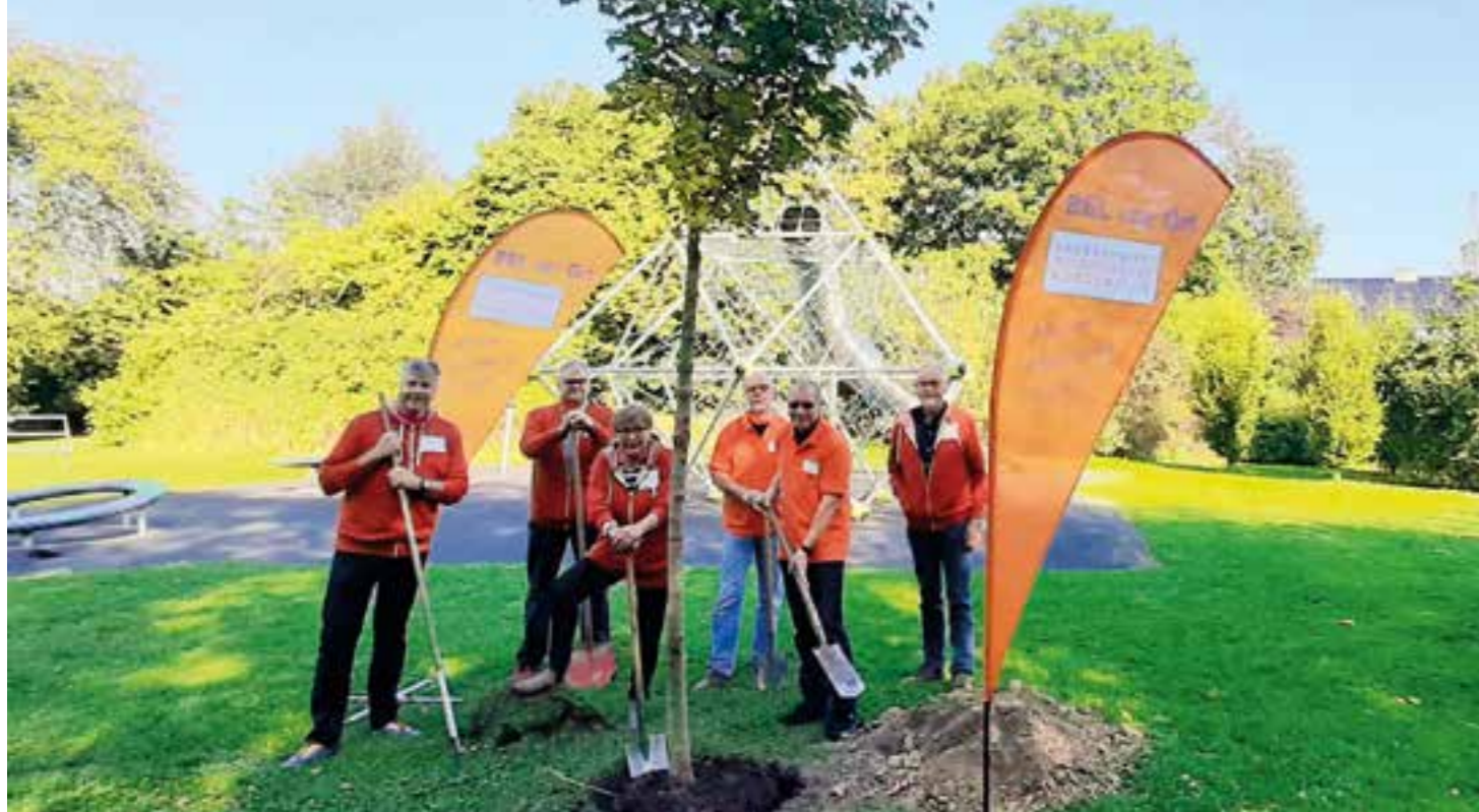
Im Rahmen der im Zusammenhang mit dem Tag der deutschen Einheit 2019 ins Leben gerufenen Baumpflanzaktion „Einheitsbuddeln“ spendierte der Bürgerblock auch in diesem Jahr der Gemeinde wieder einen Baum. Gepflanzt wurde der schon recht stattliche Ahorn am 03. Oktober 2020 auf dem Spielplatz an der Kantstraße.