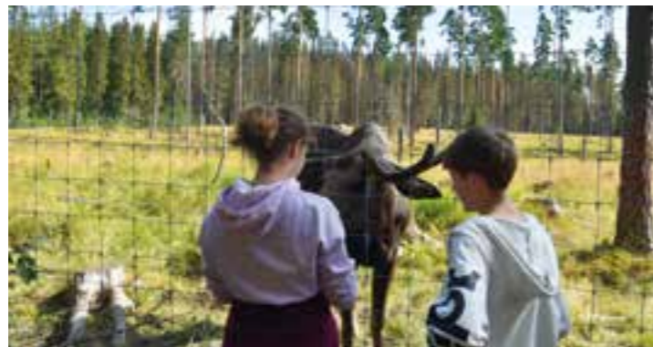
Die Schwedenfreizeit wird liebevoll als Elchtour bezeichnet. 2019 durften einige Elche bestaunt und gestreichelt werden.

es für die Kinder und Jugendlichen ist, wieder unterwegs sein zu können, raus zu kommen und gemeinsam mit Gleichaltrigen eine besondere Zeit erleben zu können. Ich bin davon überzeugt, dass eine Freizeit mit möglichen Einschränkungen deutlich besser ist als keine Freizeit. Im Idealfall bestehen diese Einschränkungen dann lediglich aus einer reduzierten Zahl an Teilnehmer*innen, verstärkten Hygiene-Schutzmaßnahmen und dem häufigen Tragen einer Mund-Nase-Bedeckung“, erklärt der Jugendreferent.