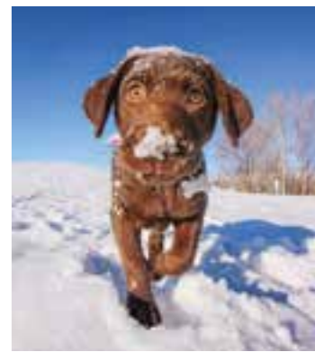
Das Stapfen durch Schnee ist für Hunde anstrengender, als auf befestigten Waldwegen herumzutollen. Vor dem Winterurlaub sollte man seinen Hund deshalb entsprechend trainieren.

Spaziergänge und Wandertouren durch den Wald sind auch im Winter problemlos möglich, solange Herrchen und Frauchen die oben genannten Punkte berücksichtigen und die Routen auf die Bedürfnisse des Vierbeiners abstimmen. Auf Skipisten sind Hunde hingegen strikt verboten. Auch für Schlittenbegeisterte gilt: lieber nicht gemeinsam mit dem Hund. Unvorhersehbare Handlungen von Mit-