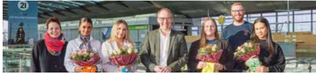
Verabschiedung und Beglückwünschung der Auszubildenden am Dortmund Airport.

Der Dortmund Airport freut sich, drei ehemalige Auszubildende als neue Mitarbeiterinnen begrüßen zu dürfen.