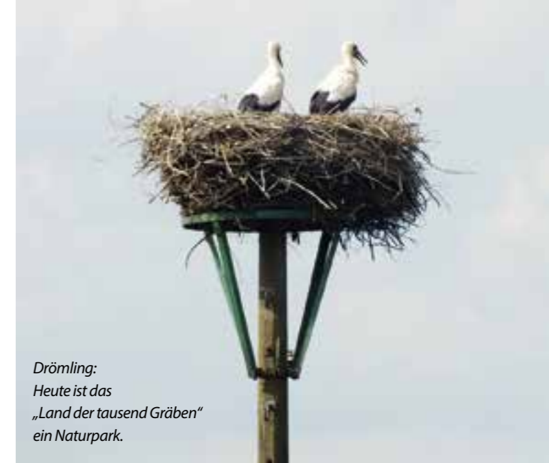
Drömling: Heute ist das „Land der tausend Gräben“ ein Naturpark.