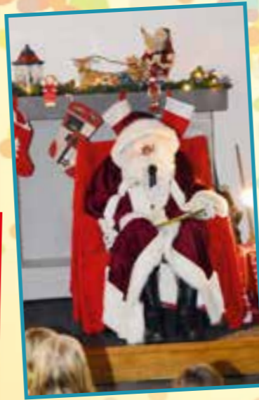
Der Nikolaus war im Dezember zu Besuch bei der Rot-Gold Jugend.