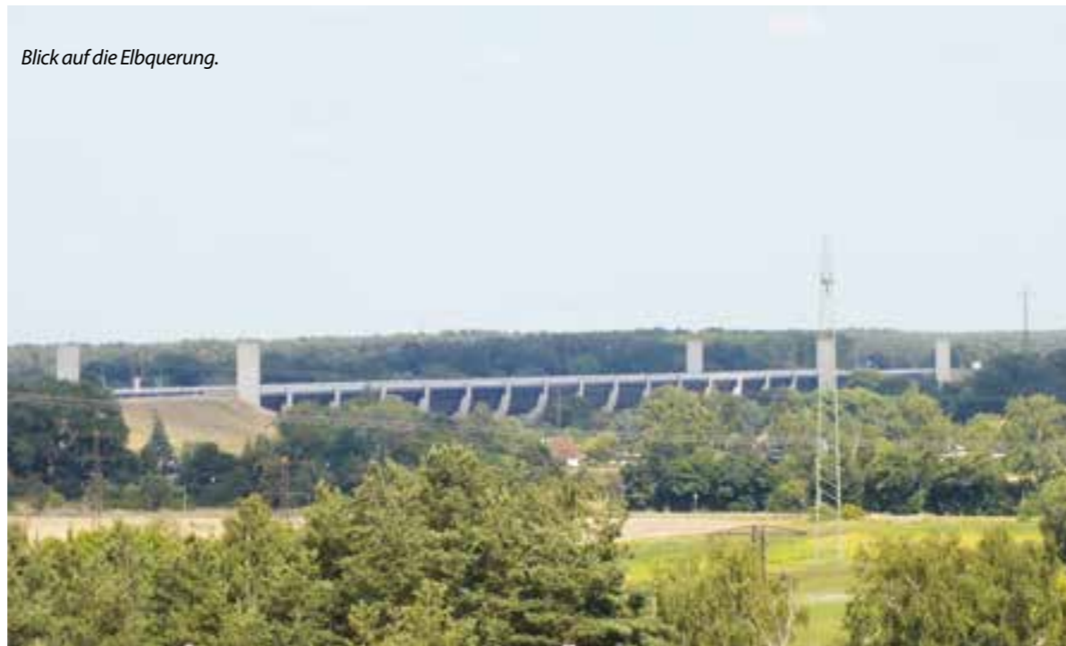
Blick auf die Elbquerung.