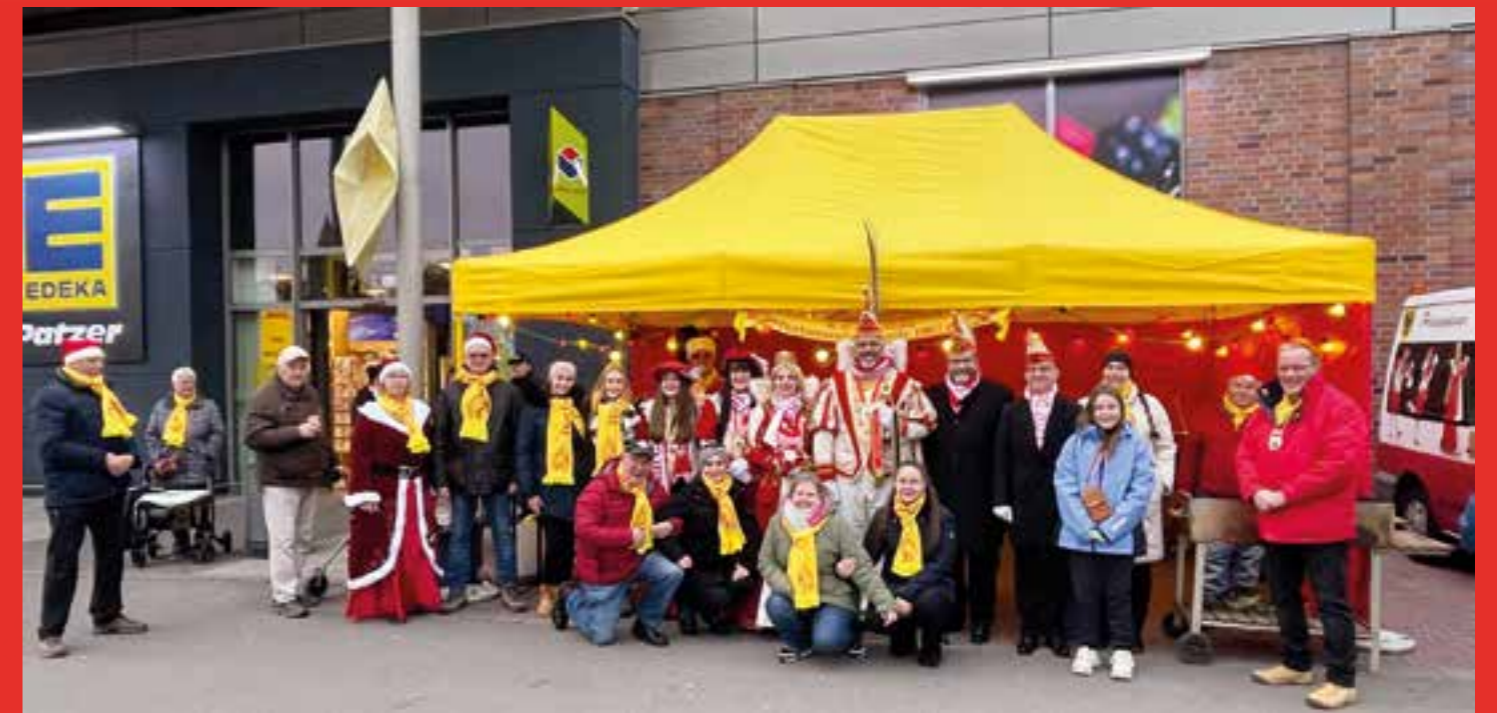
Am 03. Dezember 2022 fand der Mini-Weihnachtsmarkt der KG Rot-Gold Dortmund-Wickede 1967 e.V. vor Edeka Patzer statt. Nach dem Einkaufen konnte man noch am Stand bei Glühwein oder Kakao verweilen. Oder sich noch eine Bratwurst oder frische Waffel mit nach Hause nehmen.