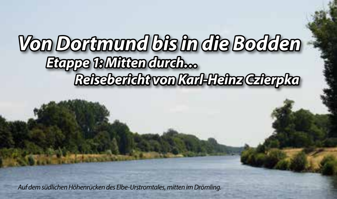
Auf dem südlichen Höhenrücken des Elbe-Urstromtales, mitten im Drömling.