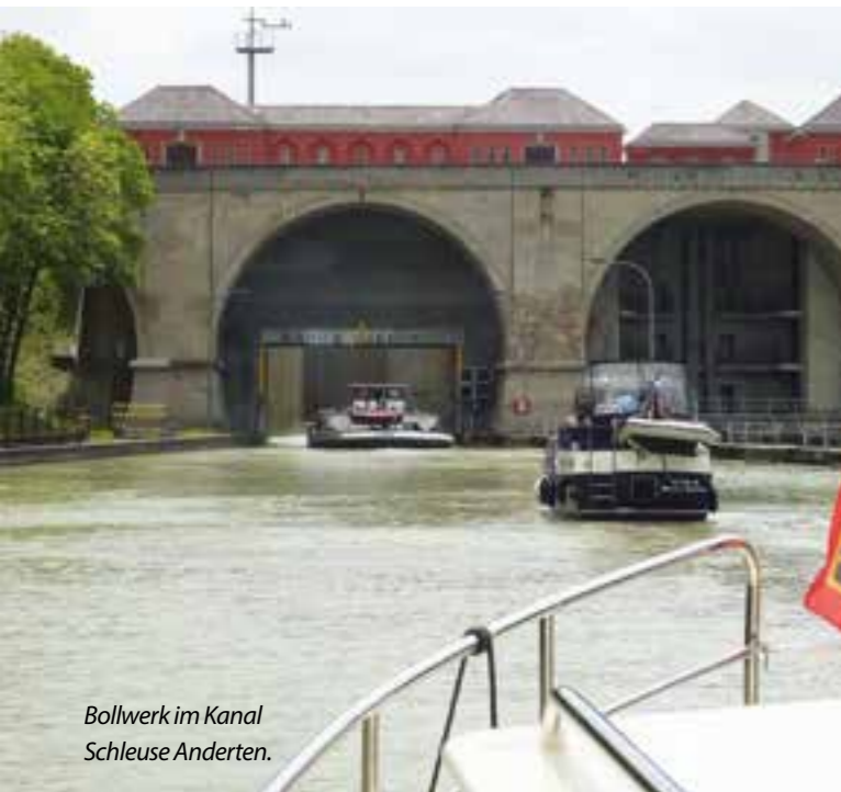
Bollwerk im Kanal Schleuse Anderten.