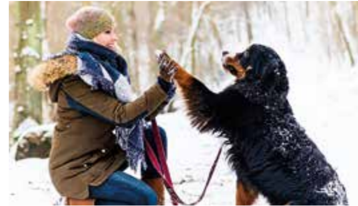
Mit ausreichend Training, etwas Pflege und der richtigen Ausstattung wird auch der Winter mit Hund sportlich.