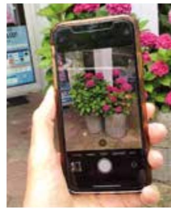
Der sichere Umgang mit iPhones oder iPads für iOS-basierte Geräte kann im Repair Café Wambel erlernt werden.

Kursleitung hat Jason Drees (Mitarbeiter im Repair Cafe Wambel). Anmeldungen nimmt das Seniorenbüro Brackel unter der Rufnummer 0231-5029640 entgegen. Veranstalter ist die Evangelische St. Reinoldi Kirchengemeinde, Repair Cafe Wambel. Die Kursgröße ist auf maximal 8 Teilnehmer*innen begrenzt. Erfahrene Nutzer*innen, die weitere, vertiefende Kenntnisse im Umgang mit ihrem iPhone/iPad erwerben und Nutzungsmöglichkeiten kennenlernen möchten, werden gebeten, sich mit den örtlichen Anbietern im Stadtbezirk Brackel