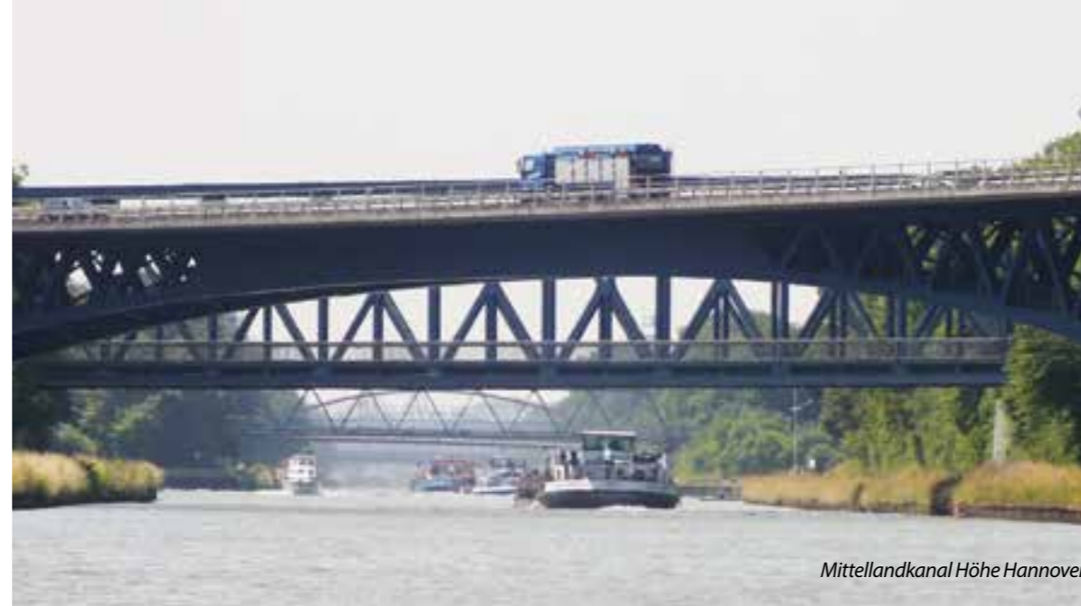
Mittellandkanal Höhe Hannover