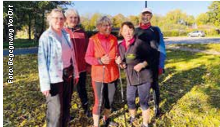
Freitag um 19:00 Uhr auf dem Parkplatz des Kleingartenvereins

Endlich ist es wieder länger hell, so dass die Aktiven der Walkinggruppe wieder zeitgleich mit den Laufgruppen am Abend starten werden. Begegnung VorOrt Brackel lädt gemeinsam mit dem Lauf- und Walkingtreff Dortmund-Ost zur Teilnahme an der Walkinggruppe ein. Ob mit oder ohne Stöcke, jede*r ist willkommen. Seit April trifft sich die Gruppe wieder jeden Dienstag und