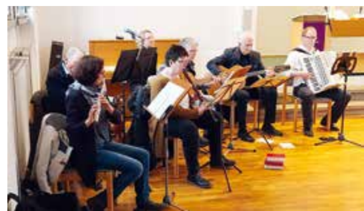
Die siebenköpfige Band „Spiel dein Instrument“ begleitete den Abendmahlsgottesdienst in der Ev. Jakobus Kirche in Wambel.

Mit Liedern unter anderem wie „Amazing Grace“, „Wenn das Brot, das wir teilen“ und „Pilger sind wir Menschen“ entwickelt sich die Band zu einer Bereicherung in der musikalischen Landschaft