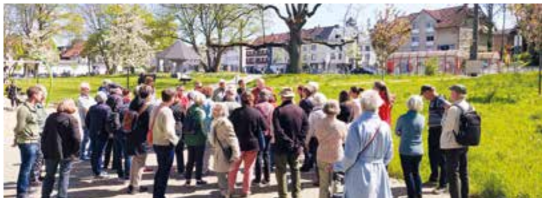
Auch am Wambeler Park ging es vorbei.