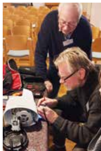
Team-Arbeit ist Trumpf in den weltweit über 2.000 Repair Cafés, so auch in Wambel, wo im Saal des Ev. Jakobus-Gemeindehauses seit 2015 ein Repair Cafe alle 6 bis 7 Wochen stattfindet.

den beim Umgang mit ihrem Handy oder dem Smartphone zur Verfügung und konnten mit ihrem Wissen die Probleme nicht nur mit wenigen Tastenklacks beseitigen, sondern auch für zukünftige, wiederkehrende Problemfälle den Besitzer*innen die Lösungswege erklären. Dank eines neuen, engagierten Mitarbeiters können nun auch wieder defekte Holzgegenstände erfolgreich repariert werden und sobald die Suche nach interessierten Mitarbeiter*innen im Umgang mit Nähmaschinen erfolgreich abgeschlossen ist, sollen auch kleinere Reparaturen von Kleidungsstücken wieder möglich sein. Radfahrer*innen, die ihr Fahrrad wieder rechtzeitig für das Frühjahr und den Sommer fahrtauglich machen möchten, haben im Repair Cafe Wambel ebenfalls eine Chance gemeinsam mit den Mitarbeitenden die vorhandenen Defekte zu reparieren. Es empfiehlt sich dabei die neu zu kaufenden Ersatzteile, sofern man sie denn kennt, direkt mitzubringen. Das Repair Cafe Wambel findet ca. alle 6 bis 7 Wochen, jeweils freitags in der Zeit von 16:00 bis 19:00 Uhr im Ev. Jakobus Gemeinde-