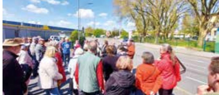
Die Teilnehmer führte es entlang der Rüschebrinkstraße.