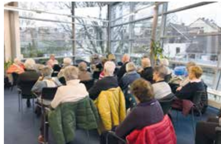
Mit großem Interesse verfolgten während des 88. Literaturcafés zahlreiche Bücherfreund*innen die Vorträge.