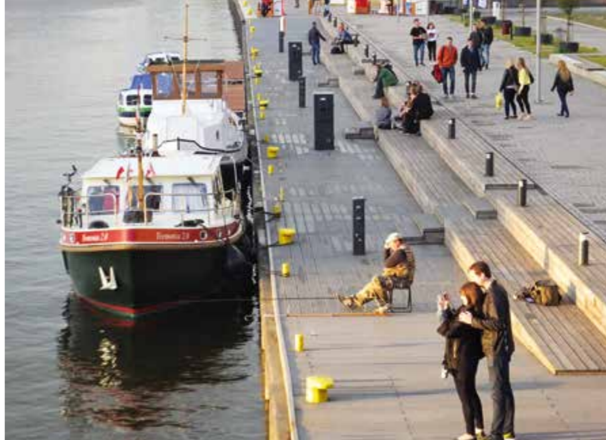
Stadthafen Stettin am frühen Abend

Deutschland gehören, aber Polen hat sich mit dem Segen Stalins nicht um die Beschlusslage geschert und sich mit Szczecin (Stettin) und Świnoujście (Swinemünde) zwei große Seehäfen einverleibt. Selbst die heftige Genossenschaft aus Ostberlin konnte daran nichts ändern. Aus Protest tilgte die DDR das Stettiner Haff daraufhin aus ihren Karten: Pommersches Haff hieß es hier, Bruderstaat hin oder her! Über das Haff mündet die Oder in die Ostsee, sie bildet dazu drei Arme: Peenestrom, Swine und Dzwina. Folglich gibt es zwei Inseln, von denen Usedom sicher die bekannt-