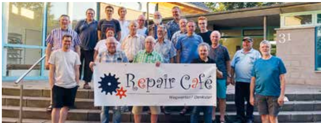
Das Team des Repair Cafés Wambel freut sich auch zukünftig über viele Reparaturanfragen.

Hiervon dürfen zumindest die 30 ehren- und hauptamtlichen Mitarbeiter*innen weiterhin ausgehen, wenn man den Start des ersten Repair Cafés in 2023 zu Grunde legt. 37 defekte Geräte, vom Akku-Sauger über CD-Spieler, Drucker, einem Holz-Kleidungsständer, Lampen und Lichterbögen, Kaffee- und Nähmaschinen, bis hin zu Radios, Toaster und Wasserkocher, wurden zunächst im Ev. Jakobusgemeindehaus Wambel unter die Lupe genommen, um so die Fehlerquelle zu entdecken. In immerhin 11 Fällen war eine sofortige Reparatur möglich, in weiteren 15 Fällen soll ein Ersatzteilkauf und späterer Einbau oder der Verweis auf eine Fachfirma das jeweilige Gerät wieder ans Laufen bringen. Kleinere Wartezeiten wurden bei Kaffee, Kaltgetränke und Gebäck am liebevoll gedeckten Tisch überbrückt. Dort sorgten die ehrenamtlichen Mitarbeiterinnen für gute Laune und Kommunikation unter den Wartenden.