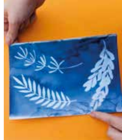
In mondos Atelier lassen wir die Sonne die schönsten Drucke. Das AGARD-Naturschutzhaus bietet eine familienfreundliche Führung, in der die Teilnehmer die verschiedenen Rückzugsorte für die vielseitige Tierwelt des Westfalenparks kennenlernen können. Die Rosenfreude laden um 14:30 Uhr zu einer exklusiven Führung durch die Gärten des Deutschen Rosariums ein. Die ParkAkademie präsentiert ein buntes Programm für jedes Alter. Für Eltern und Großeltern gibt es Kaffee und Kuchen, während die Kinder mit bunten Wachsmalern Taschen gestalten. Die „Älteren“ erwartet ein kleiner Gedächtnistraining-Par-

Tag der Nachbarn Die Nachbarn im Westfalenpark laden am Freitag, den 26. Mai von 14:00 bis 17:00 Uhr zu einem bunten Nachmittag mit einem interessanten Programm für Jung und Alt ein. Im mondo mio! Kindermuseum entstehen mithilfe der Sonne die schönsten Drucke. Das AGARD-Naturschutzhaus bietet eine familienfreundliche Führung, in der die Teilnehmer die verschiedenen Rückzugsorte für die vielseitige Tierwelt des Westfalenparks kennenlernen können. Die Rosenfreude laden um 14:30 Uhr zu einer exklusiven Führung durch die Gärten des Deutschen Rosariums ein. Die ParkAkademie präsentiert ein buntes Programm für jedes Alter. Für Eltern und Großeltern gibt es Kaffee und Kuchen, während die Kinder mit bunten Wachsmalern Taschen gestalten. Die „Älteren“ erwartet ein kleiner Gedächtnistraining-Par-