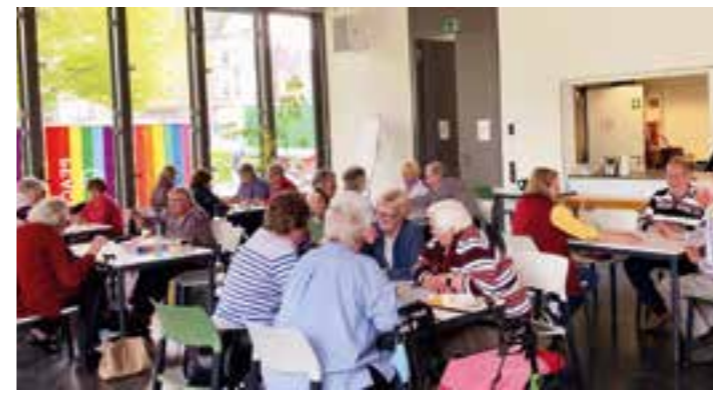
Gemeinsames Spielen im Café Spiel mit Spaß Brackel/Neuasseln ist ein probates Mittel – insbesondere für alleinstehende Senior*innen- gegen Vereinsamung im Alter.

sorgt sein. Nachdem der Volksgarten Mengede als neuer Veranstaltungsort schon im letzten Jahr sehr gut angenommen wurde, findet auch in diesem Sommer erneut ein DJ Picknick im Dortmunder Vorort statt. Nicht weit vom Bahnhof „Dortmund-Mengede“, mit bester Anbindung in alle Richtungen, wird hier am 22. Juli Halt gemacht. Zwei Wochen später, am 5. August, findet der vorletzte Termin an den Dortmunder Westfalenhallen statt. Zum großen Finale der diesjährigen Summersounds DJ Picknicks erwarten die Veranstalter:innen die großen und kleinen Besuchenden am 12. August auf Phoenix West (Grünkeil). Die DJ Picknicks sind bekannt für Sommervibes, Tanzen, Familienfreundlichkeit sowie gute Musik und Gesellschaft. Musikalisch werden sich die Genres von House über 2000er bis hin zu Hip Hop bewegen - damit ist für jede:n etwas dabei. Ebenso können Getränke und Speisen selbst mitgebracht werden. Alternativ wird es vor Ort verschiedene Streetfood- und Getränkeangebote geben. Die Summersounds DJ Picknicks werden von der Dortmund-Agentur in Zusammenarbeit mit dem Upop e.V. und dem Jugendamt Dortmund veranstaltet. Weitere Informationen und FAQs gibt es auf www.djpicknick.de oder auf Instagram (@summersounds_dj_picknicks).