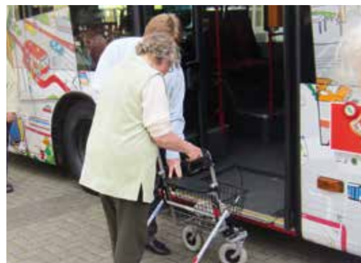
Sicher mit dem Rollator unterwegs heißt es am 6. Juli beim Informationstag auf dem Brackeler Wochenmarkt.

Mit insgesamt acht Veranstaltungen noch bis September präsentiert sich das Seniorenbüro Brackel gemeinsam mit den Mitgliedern des NetzWerks Aktiv ÄlterWerden und Kooperationspartner*innen zu vielfältigen pflege- und seniorenrelevanten Themen für Senior*innen und deren Angehörige auf dem Brackeler Wochenmarkt.