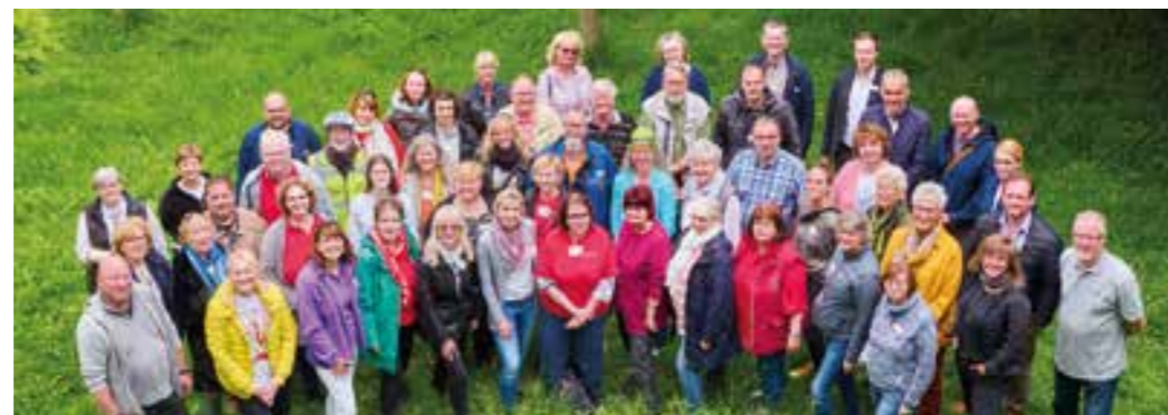
Team Seniorenbüro Netzwerk Brackel.