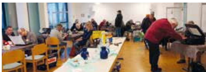
37 defekte Geräte wurden beim ersten Repair Cafe in 2023 unter die Lupe genommen, um so die Fehlerquelle zu entdecken.

Parallel lud die Gemeindebücherei „Die Leserratte“ bis 17:00 Uhr zum Stöbern nach neuen Lesefuttern für zu Hause ein. Sie ist mit Romanen, Krimis und einer großen Auswahl an Kinder- und Jugendbüchern ausgestattet. Anschließend standen Mitarbeiter*innen des Repair Cafés und von youngcaritas fünf Ratsuchen-