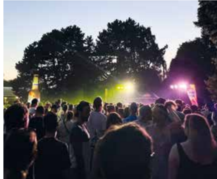
Best of Summersounds 2022.

Nach dem fulminanten Comeback im vergangenen Sommer geht es auch in 2023 weiter!