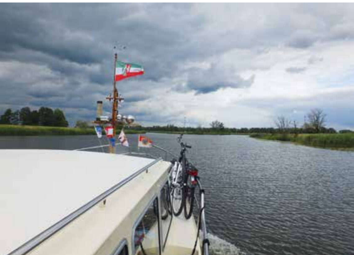
Regenfront auf der Westoder

Wir sind an der Oder, aber wir kommen nicht auf den Fluss, der im Sommer meistens zu wenig Wasser hat!