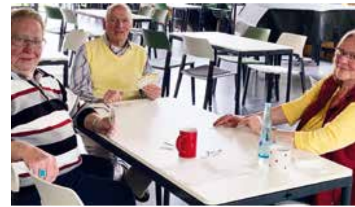
Auch Skat oder Schachspieler*innen sind herzlich willkommen.