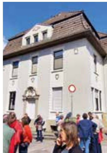
Dieses alte Wohnhaus war eine ehemalige Kornbranntwein-Brennerei (Ecke Gosestraße/Dorfstraße).