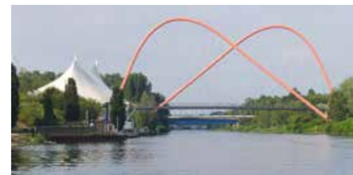
Weltbekannte Brücke am Nordsternpark in Gelsenkirchen