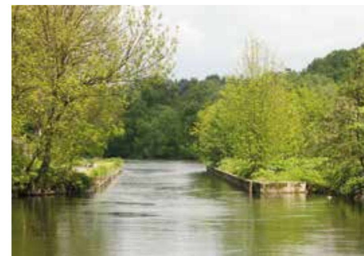
Schleuse Rote Mühle an der Ruhr