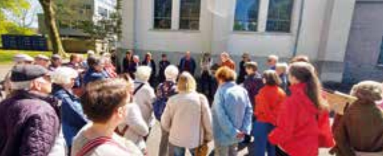
Vor der Ev. Jakobus Kirche begann der Stadtteilspaziergang im April.