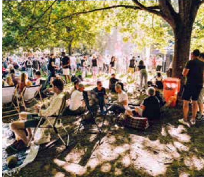
Summersounds DJ Picknicks am 2. Juli 2022.

Summersounds DJ Picknicks kündigen Termine an