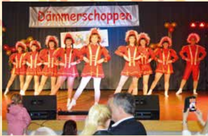
Die Aktivengarde wurde vom Publikum mit tollem Applaus belohnt.