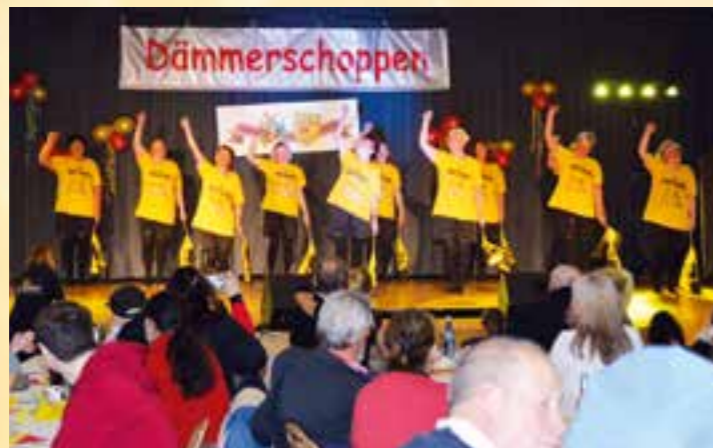
Auch die „SpasGirls“ durften nicht fehlen und unterhielten die Gäste mit ihrem neuen Tanz.