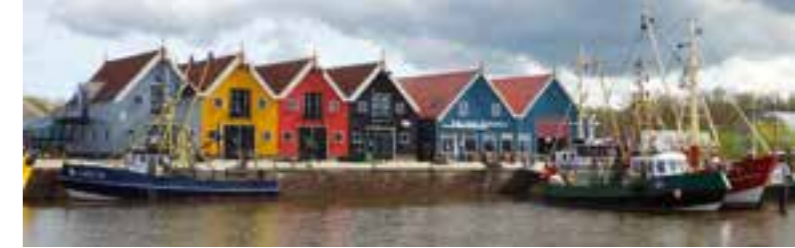
Lauwersmeer: Hafen von Zoutkamp, früher wichtiger Fischereihafen, heute liegt die Flotte in Lauwersoog.