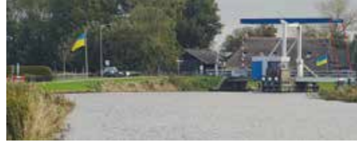
Solidarität mit der Ukraine auch in Friesland.

6. Aus dem weißen Fondant 20 kleine Kugeln rollen. Die Kugeln mit den Resten der geschmolzenen Schokolade oben auf den Mützen festkleben. Nach Belieben die Kugeln dünn mit etwas geschmolzener Schokolade bepinseln und mit den übrig gebliebenen Kokosraspeln bestreuen. Die Weihnachtsmützen-Trüffel im Kühlschrank aufbewahren und innerhalb von fünf Tagen verzehren. (djd)