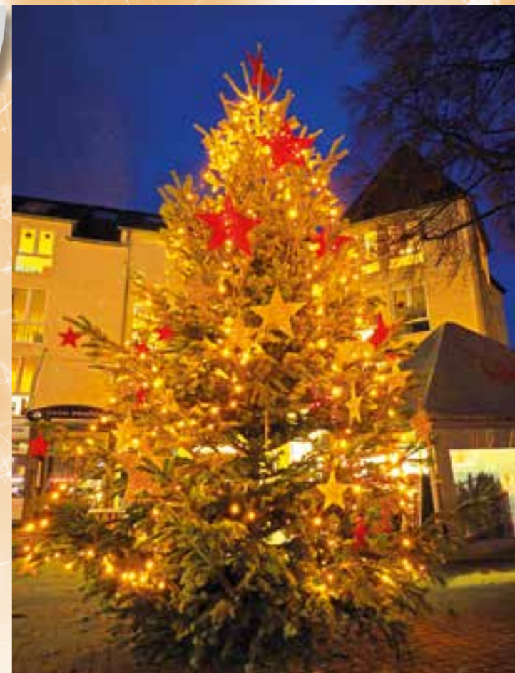
Der Weihnachtsbaum auf dem Levi-Cohen-Platz sorgt für eine adventliche Stimmung.

wieder viele interessante Preise zu gewinnen. Diese werden am 17.12., rechtzeitig vor dem Weihnachtsfest an die glücklichen Gewinner übergeben. Die IWV bedankt sich bei den engagierten Vereinen, die sich in diesem Jahr insbesondere am Sommerfest beteiligt haben und wünscht allen in Wickede ein frohes Weihnachtsfest und ein gutes Neues Jahr.