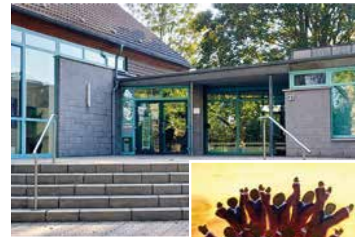
Ev. Jakobus Gemeindehaus in Wambel.