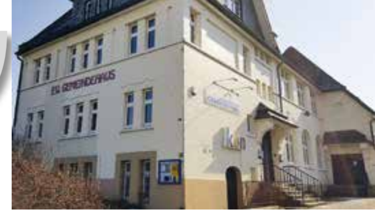
Die nächste Außensprechstunde des Seniorenbüros Brackel findet am 14. Dezember im Ev. Gemeindehaus in Asseln statt.

besondere Wirkung des Theaters. In der reinigenden Katharsis sah er die Entlastung der Zuschauenden von psychischen Spannungen: Einfach mal die Seele baumeln lassen, einfach Zeit miteinander verbringen, einen Abstand zum Geschehen bekommen und sich selbst wieder im richtigen Licht sehen. Dem Publikum, das sich derzeit Sorgen macht, um steigende Lebenskosten und Energiepreise kann man schlichtweg keine horrenden Summen für