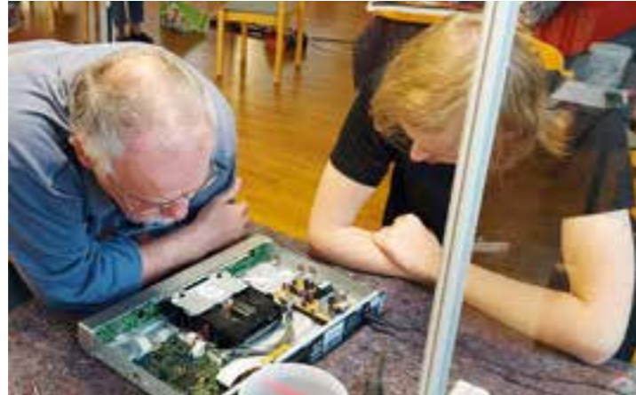
Ob alleine oder zu zweit im Team, Sorgfalt steht immer an erster Stelle.