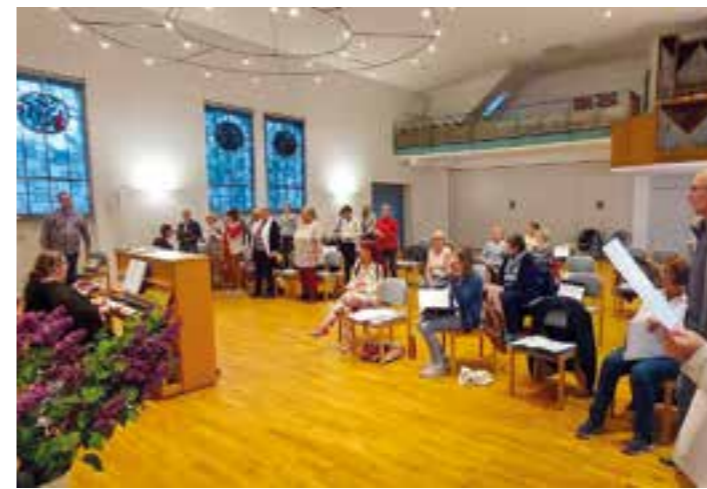
Der vierstimmige Gospelchor Enjoy the moment lädt zu seinen wöchentlichen Proben ein.