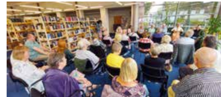
Die zahlreich erschienenen Zuhörer*innen verfolgten interessiert den Vorlesungen im Wintergarten der Bibliothek Brackel.

die Rollen von Mann und Frau im Wandel der Zeit und Fluch und Segen der modernen Techniken sind nur einige der Themen, die von den Autor*innen in teils heiteren, teils berührenden, nachdenklich stimmenden, biographischen Geschichten geschrieben