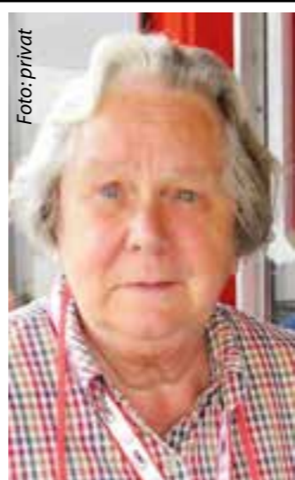
nie vergessen und ihr Andenken stets in Ehren halten.