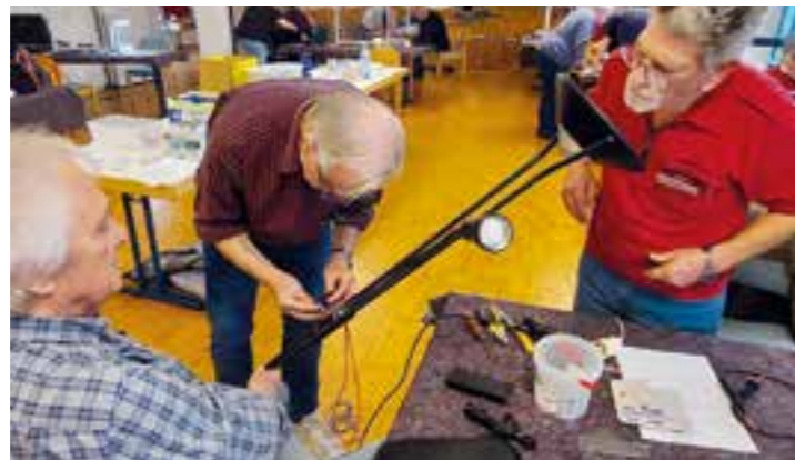
In jedem Fall sind die Besitzer*innen in einem Repair Café mit dabei und lernen im besten Fall über die Technik ihres Gerätes hinzu.

190 Handy oder 1.710 g Kupfer, 28,5 g Silber und 5,75 g Gold konnten bislang im Rahmen der umweltgerechten Recycling-Aktion der Deutschen Telekom in den letzten Monaten gesammelt werden. Der Telekompartner Teqcycle Solutions GmbH bedankte sich mit der Sammelurkunde und wird die Erlöse Projekte des Natur- und Umweltschutzes oder in soziale Projekte der Kooperationspartner zu führen. Näheres hierzu unter: www.handysammelcenter.de . Viele der wiederverwertbaren Geräte wurden im Rahmen der Repair Cafes Wambel, so auch Ende Oktober im