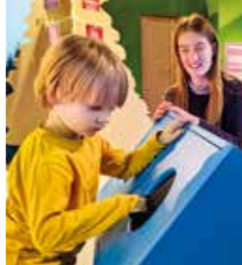
Ausstellung mit interaktiven Stationen