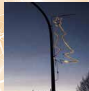
Die Weihnachtsbeleuchtung entlang des Hellwegs – umgestellt auf LED.

Schon seit einigen Jahren wurden die Beleuchtungskörper auf LED umgestellt, so dass dies mit einem geringen Stromverbrauch verbunden ist. Gleichzeitig wurde auch wieder ein Weihnachtsbaum mit Beleuchtung auf dem Levi-Cohen-Platz aufgestellt, der für eine adventliche Stimmung auf diesem zentralen Platz sorgt. Ergänzender Schmuck für den Weihnachtsbaum kann gerne von Kindergärten oder Schulklassen angebracht werden, darauf weist Dirk Sanke (Vorsitzender der IWV) hin. Bei der von der IWV gestarteten großen Weihnachtsverlosung sind auch in diesem Jahr