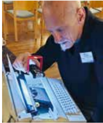
Vor einer möglichen Reparatur kommt stets die Inspektion.