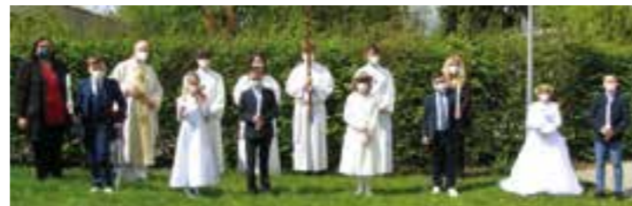
Kommunionkinder St. Joseph.