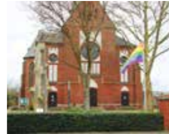
St. Clemenskirche in Do-Brackel hisst Regenbogenbanner.

altes biblisches Symbol des Segens und des Bundes, den Gott mit allen Menschen geschlossen hat. Alle Menschen, die in Liebe einander verbunden sind, stehen gleichermaßen unter Gottes Segen – davon sind die katholischen Gemeinden des Pastoralen Raums Dortmund-Ost überzeugt. Übrigens ist interessant: das Violett in der Queer-Regenbogenfahne steht für Spiritualität.