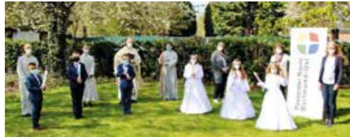
Kommunionkinder Vom Göttlichen Wort (Feier 1).

wieder neue Angebote geschaffen. So haben die Familien einzeln bei Stationsgängen den Kirchenraum erlebt oder sich an ihre Taufe erinnert, später waren auch kindgerechte Gottesdienste in den kleinen Erstkommuniongruppen möglich.