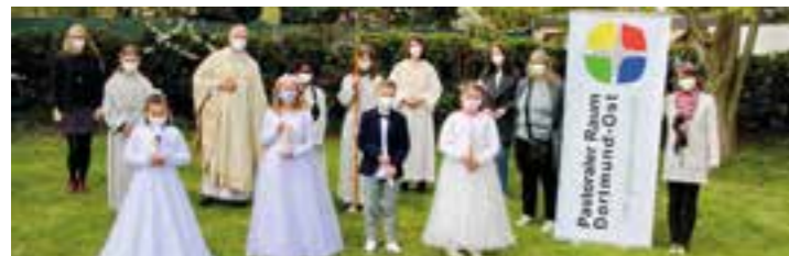
Kommunionkinder Vom Göttlichen Wort (Feier 3).