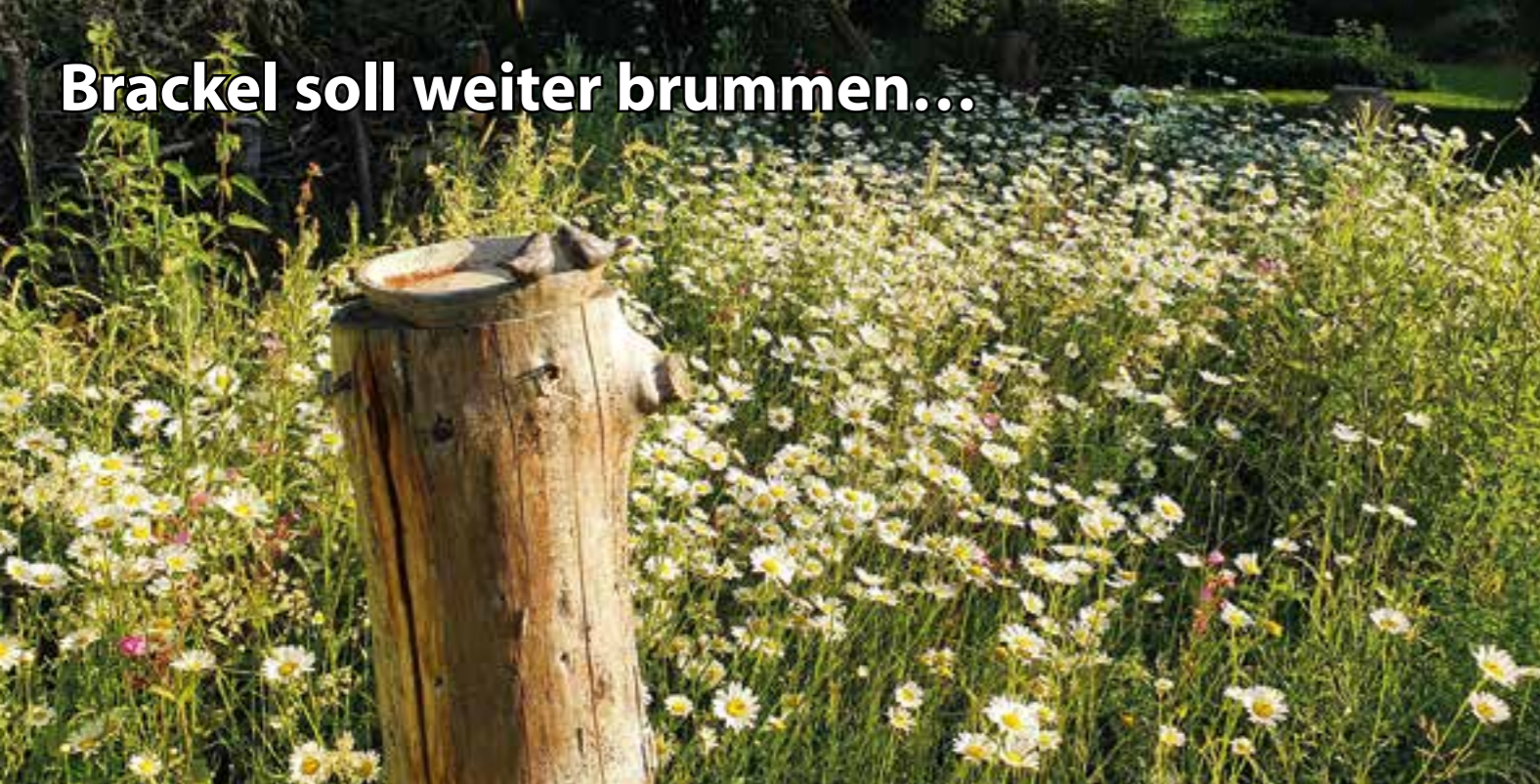
Brackeler Margeriten in Dortmund-Scharnhorst - die Domanski-Wiese.