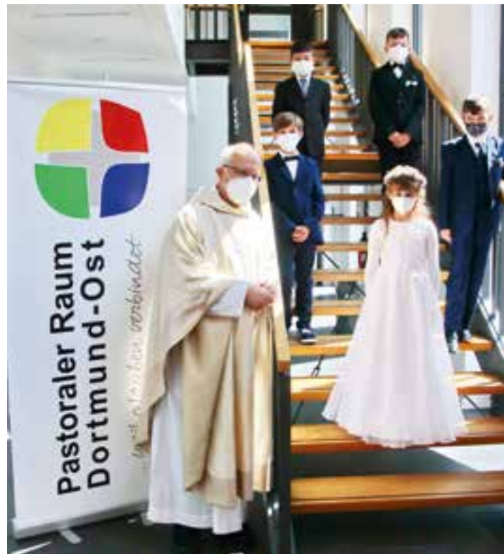
Kommunionkinder St. Clemens (Feier 1).