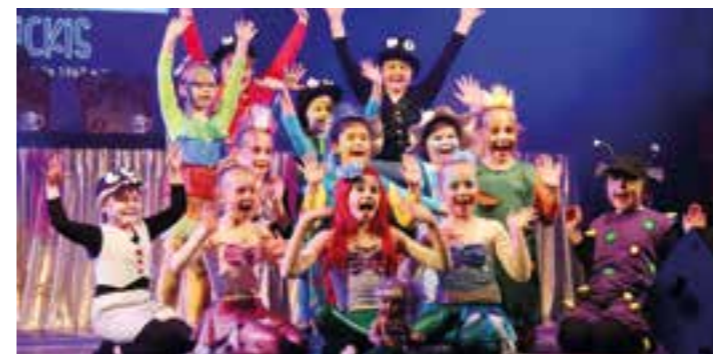
Prunksitzung 2020 – Mini-Wickis.

Auf Grund der sinkenden Inzidenzwerte kann die Karnevalsgesellschaft Rot-Gold Dortmund-Wickede 1967 e.V. das Training auch wieder in den vorhandenen Trainingsräumen durchführen.