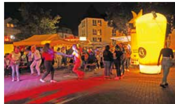
So schön war es bei Wikkis Streetfood in 2019.

In den vergangenen Wochen hat sich die Interessengemeinschaft Wickedere Vereine e.V. (IWV) mit verschiedenen Möglichkeiten eines Sommerfestes in Wickede befasst und ist zum vorläufigen Schluss gekommen, dass unter den derzeitigen Umständen die Durchführung eines Festes wie „Wikkis Streetfood“ nicht realisiert werden kann.