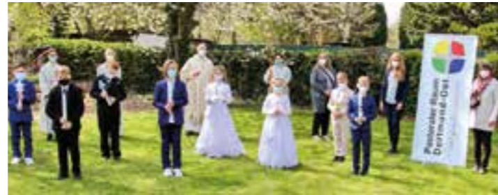
Kommunionkinder Vom Göttlichen Wort (Feier 2).