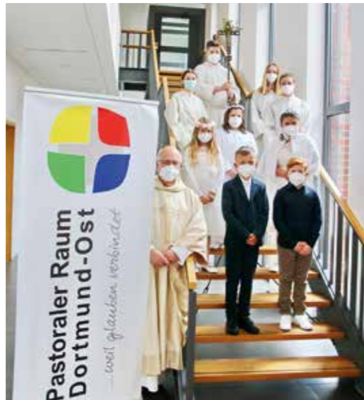
Kommunionkinder St. Clemens (Feier 2).