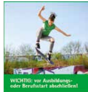
WICHTIG: vor Ausbildungs- oder Berufsstart abschließen!

hofft wird auch die Möglichkeit, endlich die neue Begegnungsstätte an der Husener Straße offiziell einzuweihen. Mit einem kleinen Sektempfang, kleinem Mittagssnack und anschließender Ehrung der langjährigen Mitglieder soll dazu ein würdiger Rahmen geschaffen werden. Ebenso fallen in die Aktionswoche die längst überfälligen Jahreshauptversammlungen mit Neuwahl der Vorstände von AWO-Ortsverein und Förderverein Marie-Juchacz-Haus e.V. Neben den klassischen sportlichen, kreativen, musischen, Handarbeits- und Vortragsangeboten sowie den Selbsthilfegruppen und Gesprächskreise sind für Dezember wieder das traditionelle Weihnachtsdorf vor dem zum Weihnachtshaus verwandelten Marie-Juchacz-Haus sowie eine Weihnachtsfeier im Asselner Lokal „Zum Bürgerkrug“ geplant. Das AWO-Team hofft sehr, dass Corona oder andere Ereignisse nicht wieder die Aktivitäten einschränken werden und freut sich auf viele Gäste rund um die Begegnungsstätten.