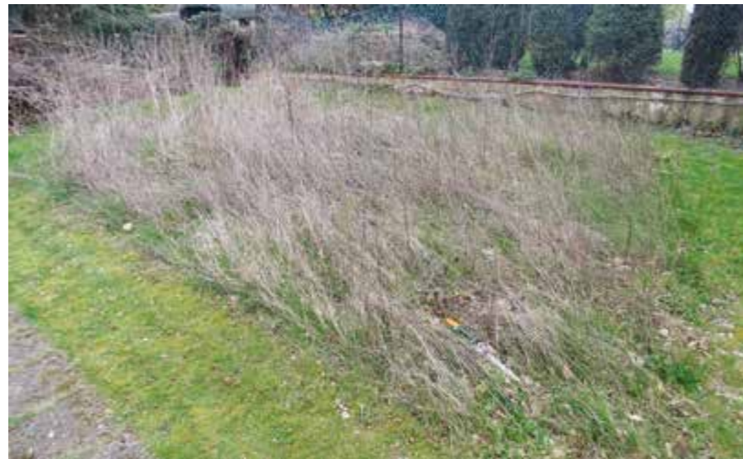
Schönheit liegt im Auge des Betrachters – Winterbild.

ckel auf mehr als 25.000 Quadratmeter Blumenwiesen, umgangssprachlich: Bienenweiden, stolz sein. Ein großer Erfolg, der sich in den kommenden Jahren verstetigte. Trotz Pandemie-Einschränkungen wur-