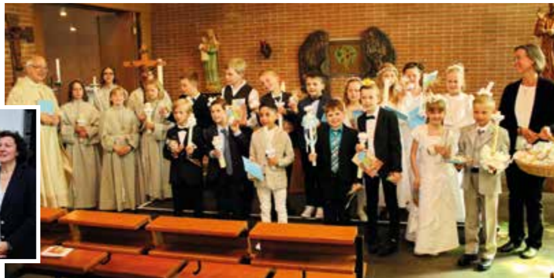
Am Sonntag, den 06. Mai 2018 gingen in der Kirche St. Nikolaus von Flüe 15 Kommunionkinder zur ersten Heiligen Kommunion. Musikalisch begleitet wurde die Gottesdienstfeier von der Gruppe Taktum.

Unter dem Motto „Jesus, wo wohnst du“ feierten Eltern, Großeltern, Bekannte und Freunde bei herrlichem Wetter mit den Kommunionkindern dieses besondere Fest. In dem festlichen Gottesdienst, der auch von den Kommunionkindern mitgestaltet wurde, traten sie zum ersten Mal zum Tisch des Herrn, um so auf neue Weise ihre Gemeinschaft mit Jesus Christus zu vertiefen. Zur Erinnerung an diesen besonderen Moment erhielten alle Kinder ein Brot, das sie mit nach Hause nehmen konnten, um es mit ihren Familien zu teilen. Musikalisch begleitet wurde die Feier von der Gruppe Taktum.