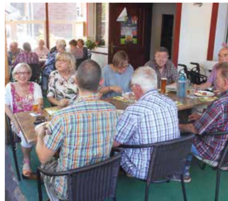
Einen tollen Schlemmer-Nachmittag verlebten 78 VdK-Mitglieder beim Grillnachmittag im Vereinslokal „Bei Angelo“. Bei bestem Wetter und vorzüglichem Grillgut gab es rund um den VdK und auch privater Natur zahlreiche Gespräche.