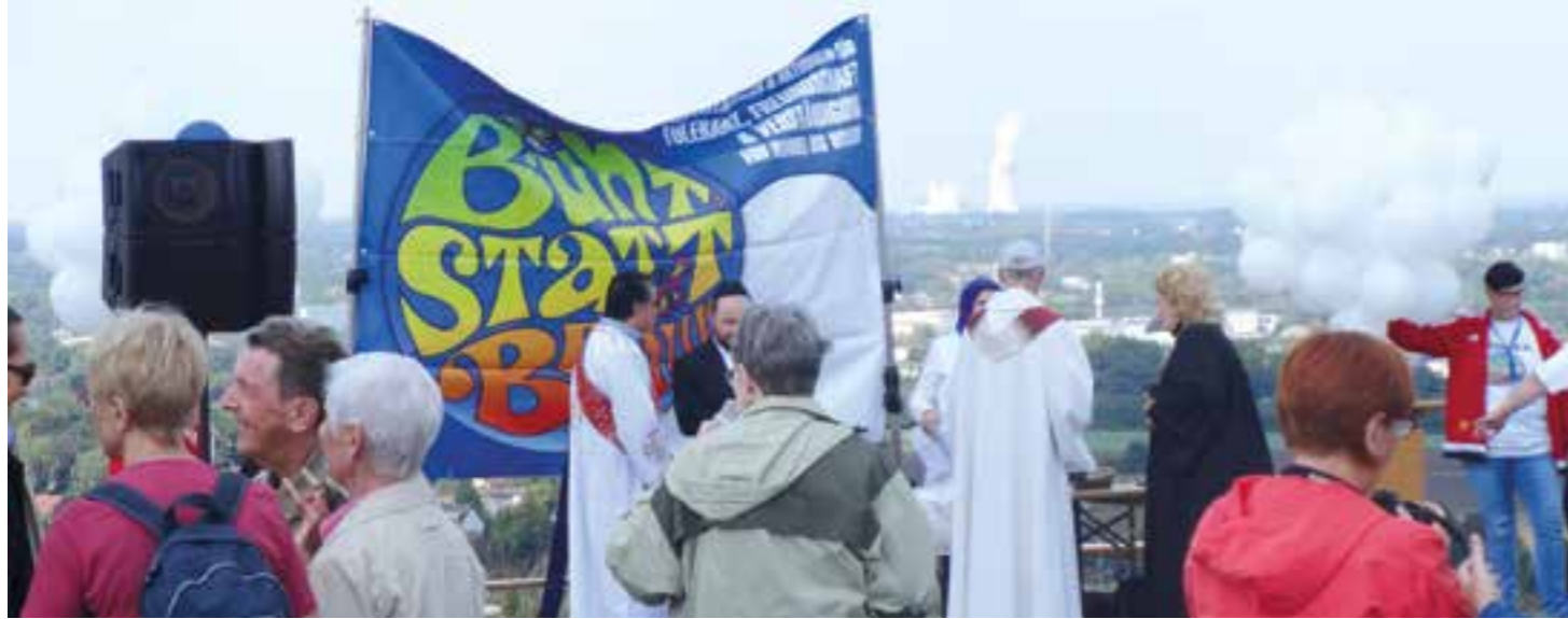
Logo beim Friedensgebet der Religionen auf der Halde Schleswig.