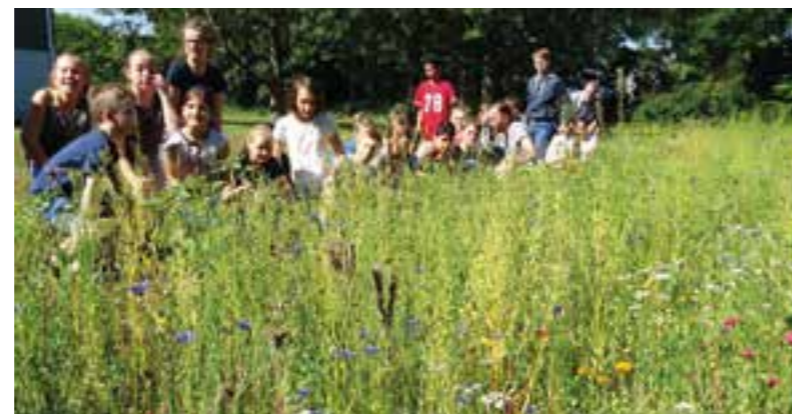
Schüler und Schülerinnen des Immanuel-Kant-Gymnasiums an der Bienenweide.

Wie wird es weitergehen? Über den Sommer werden Bezirksbürgermeister Karl-Heinz Czierpka