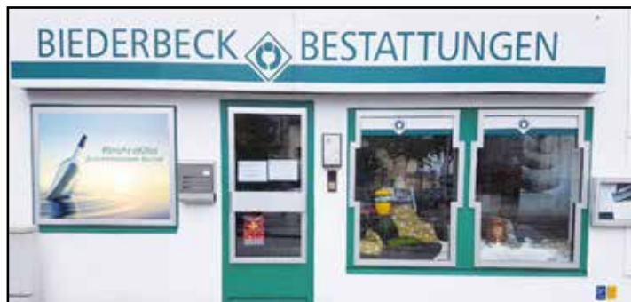
Beerdigungsinstitut Biederbeck, Am Pröbstingkamp 2 in Dortmund Asseln

Nach der herzlichen Begrüßung durch die Bestattungsberaterin Dorothea Lindhorst informierte Generationenberater Pahle kompetent zu