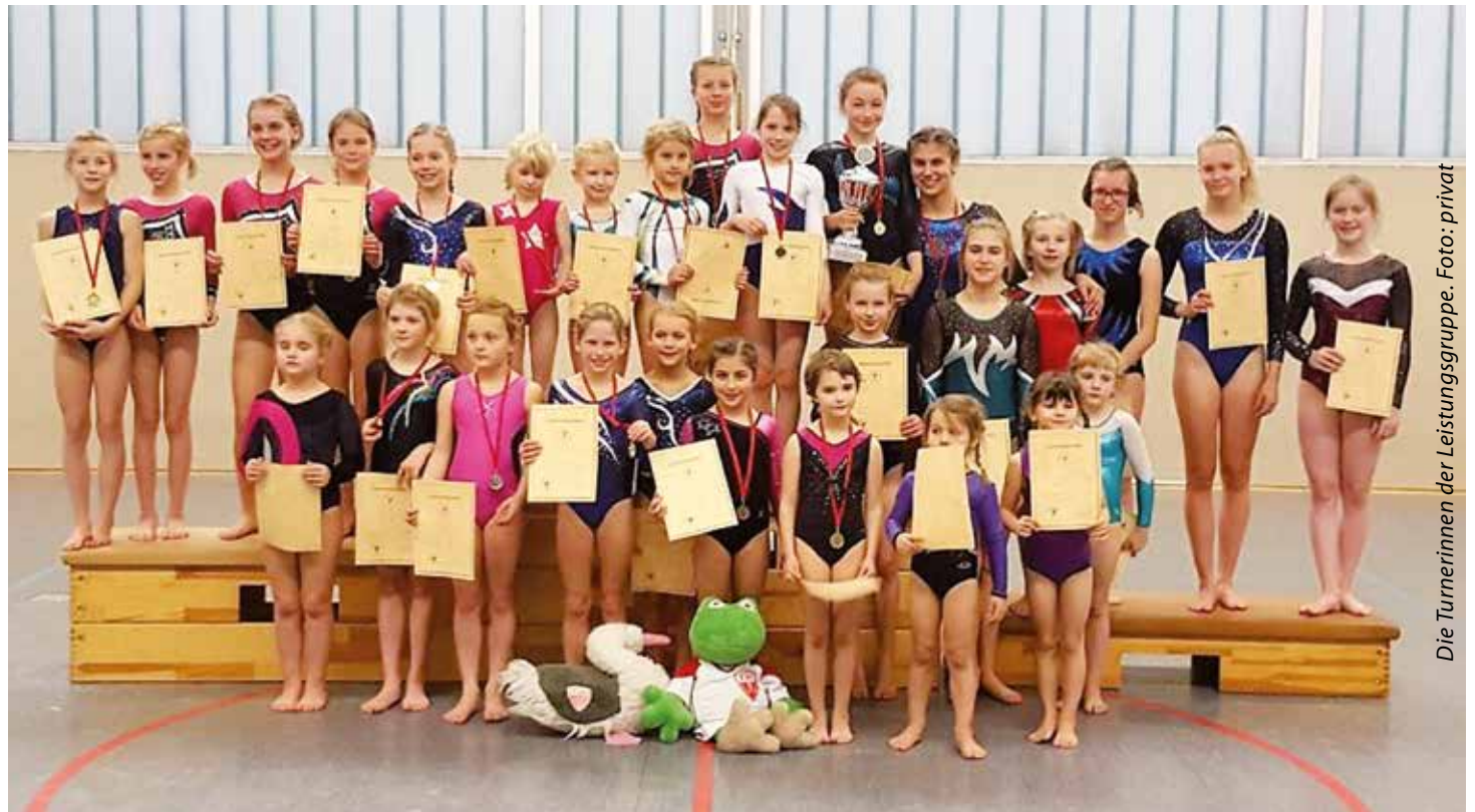
Die Turnerinnen der Leistungsgruppe.

Jedes Jahr im November kommen alle turnbegeisterten Turner und Turnerinnen des TV Arminius Wickede in der Turnhalle der Steinbrink-Grundschule zusammen, um ihre Vereinsmeister zu ermitteln.