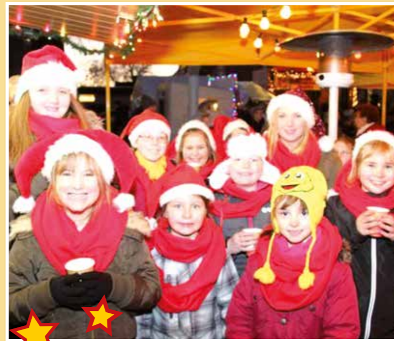
24 | Hellweg Info 6-2017

Ziehung der Lose findet dann um 17.30 Uhr statt. Sonntagnachmittag schaut der Weihnachtsmann vorbei und bringt für die Kinder eine kleine Überraschung mit. Die Interessengemeinschaft Wickede freut sich auf Ihren Besuch!