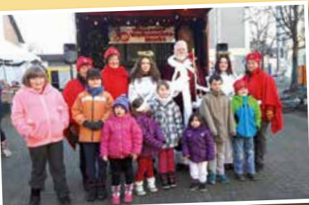
24 | Hellweg Info 6-2017

Der Weihnachtsmarkt wird im Ortskern von Wickede und zwar wie in den vergangenen Jahren, auf dem Platz vor dem Haus Lucia, am Wickeder Hellweg, vom 08. bis zum 10. Dezember stattfinden. Nach dem super Erfolg im letzten Jahr können auch diesmal die Besucher an drei Tagen über den Weihnachtsmarkt bummeln. Freitag um 18.30 Uhr eröffnet der 1. Vorsitzende der IWV Wickede