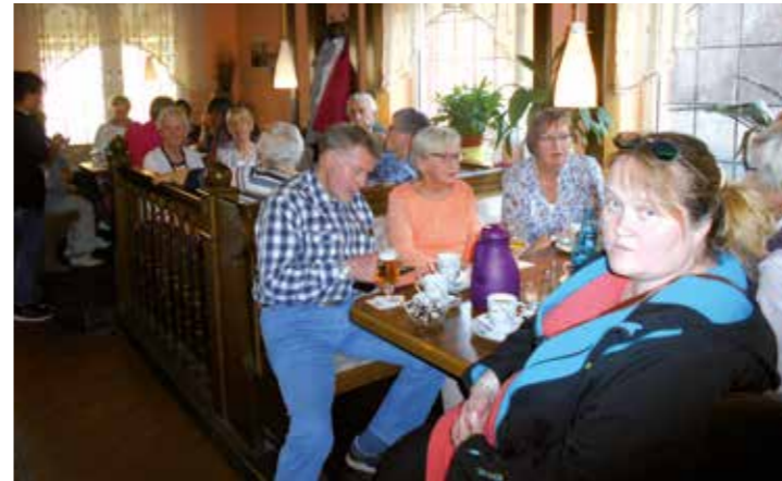
Gut besucht war die Mitgliederversammlung des Sozialverbandes VdK.