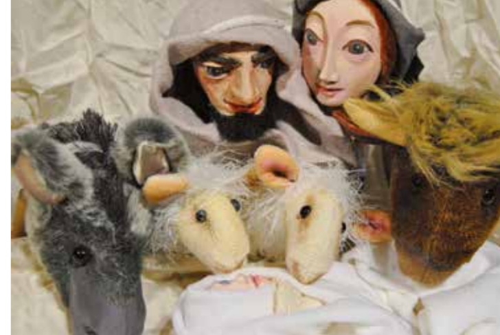
Ein Figurentheaterstück voller Zuversicht und Hoffnung für die ganze Familie.