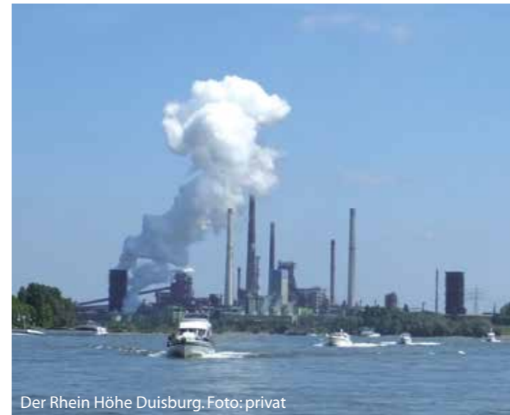
Der Rhein Höhe Duisburg.

Der Geierabend wird veranstaltet vom Kulturbüro der Stadt Dortmund und dem Theater Fletch Bizzel. Präsentator ist die Sparkasse Dortmund. Zudem unterstützen Brinkhoff's No. 1, DOGE-WO21 und die Fachhochschule Dortmund den Ruhrpott-Karneval.