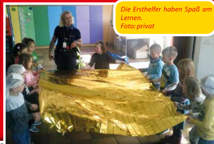
Die Ersthelfer haben Spaß am Lernen.

Die Maxi-Kinder der kath. Kindertageseinrichtung „Vom Göttlichen Wort“ wurden jeweils für eine Stunde an zwei Tagen zu „Lebensrettern“ geschult. Dies wurde vom Fachpersonal der Johanniter-Unna-Hilfe e.V. begleitet. Die Kinder lernten spielerisch die Grundlagen der Ersten Hilfe wie zum Beispiel die stabile Seitenlage und die Wundversorgung kennen.