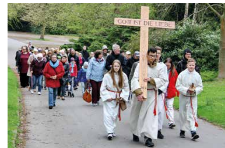
In Stille geht der Kreuzweg zu den 7 Stationen.

Alle Generationen, auch Familien mit Kindern, schlossen sich dem Kreuzweg an.