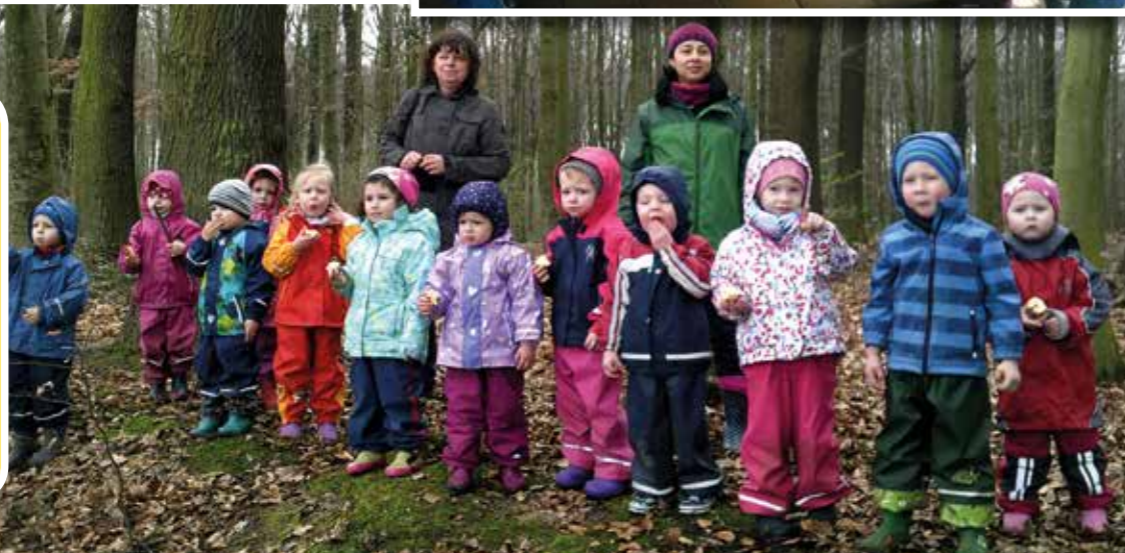
Mit allen Sinnen nahmen die Kinder der Kath. KiTa „Vom Göttlichen Wort“ die Natur wahr. Sie lernten beim Ausflug in den Wald genaues Hinsehen, Riechen, Tasten und in Stille Einzelgeräusche, wie das Zwitschern eines Vogels, kennen. Mit viel Freude entdeckten und erforschten sie ebenso den Waldboden.