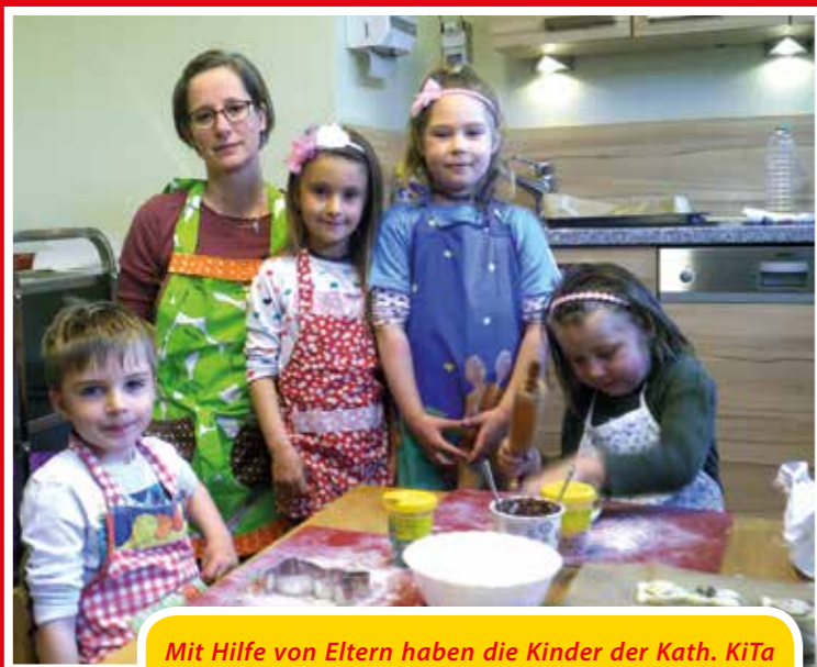
Mit Hilfe von Eltern haben die Kinder der Kath. KiTa „Vom Göttlichen Wort“ aus Wickede leckere Hasen gebacken. Die bunt verzierten Leckereien wurden auch gleich mit nach Hause genommen, um sie gemeinsam mit der Familie zu verzehren.